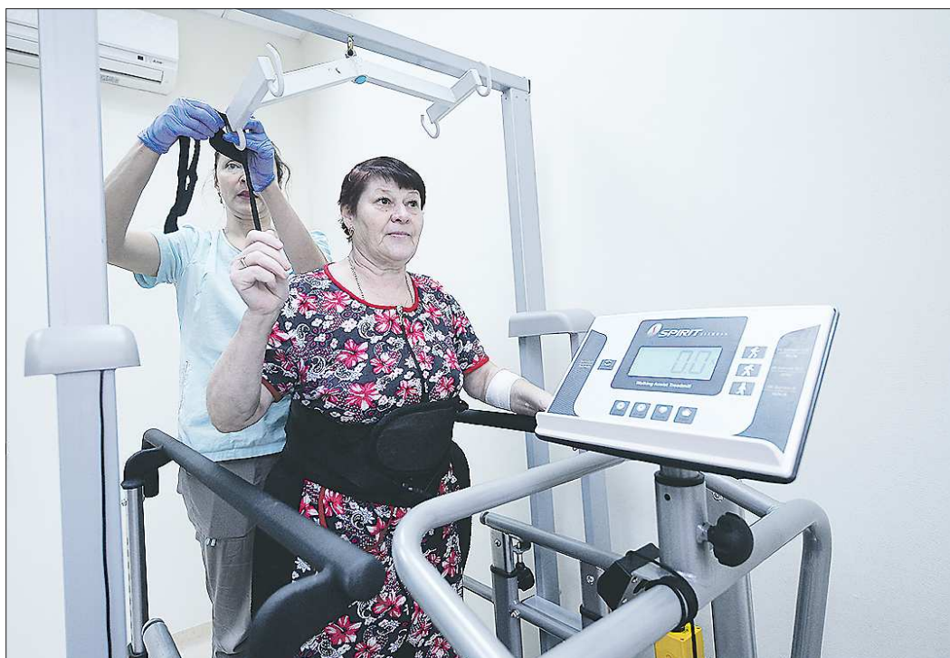
Реабилитация в центре начинается уже на следующий день после операции. Больного поднимают и заново учат ходить