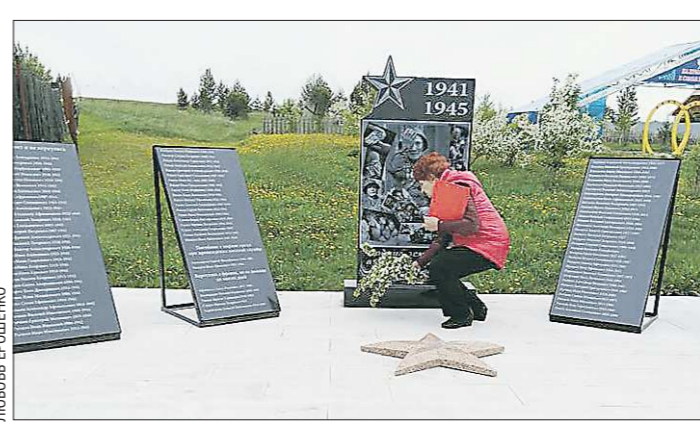
В честь героев-соколовцев

Подготовлено в соответствии с критериями, утверждёнными приказом Департамента информационной политики Свердловской области от 09.01.2018 №1 «Об утверждении критериев отнесения информационных материалов, публикуемых государственными учреждениями Свердловской области, в отношении которых функции и полномочия учредителя осуществляет Департамент информационной политики Свердловской области, к социально значимой информации».