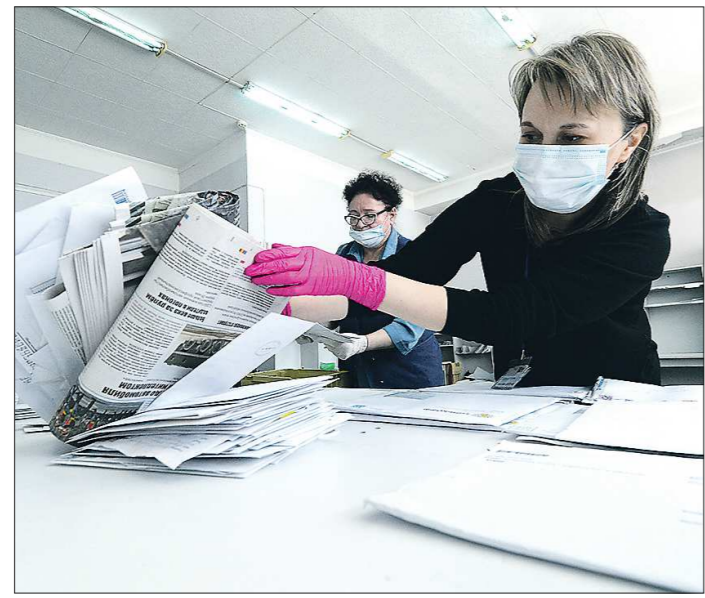
В екатеринбургском отделении №141 Почты России доставка газет, несмотря на обилие посылок с торговых интернет-площадок, остаётся на первом месте

В период коронавирусной инфекции отделения почтовой связи продолжают работать. При этом нагрузка на них возросла в разы: число доставляемых на дом посылок увеличилось, а сотрудников стало меньше, так как все почтальоны старше 65 лет находятся на больничном из-за режима самоизоляции. Но в целом отделения Почты России в регионе справились со своей задачей, о чём свидетельствует и доставка «Областной газеты» подавляющему количеству подписчиков в срок.