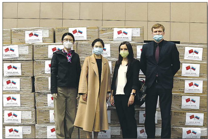
Представители генконсульства КНР в Екатеринбурге передают партию защитных масок сотрудникам правительства Свердловской области

Вчера Генеральное консульство КНР в Екатеринбурге безвозмездно передало партию защитных масок правительству Свердловской области, администрации Екатеринбурга, а до этого и некоторым другим местным органам. Эти маски были отправлены из Пекина, прошли через Москву и другие города, преодолели тысячи километров, добрались до Екатеринбурга. В них проявляется наша искренняя поддержка российскому народу в особый момент борьбы с эпидемией, также наша благодарность российской стороне за протянутую руку помощи в трудное время для Китая. Стоя перед испытанием эпидемии, Китай и Россия всегда оказывают взаимопомощь и поддержку, рука об руку борются с заболеванием, что в очередной раз демонстрирует высокий уровень и особенность китайско-российских отношений всеобъемлющего партнерства и стратегического взаимодействия нового этапа и представляет собой лучшее воплощение концепции сообщества единой судьбы человечества.