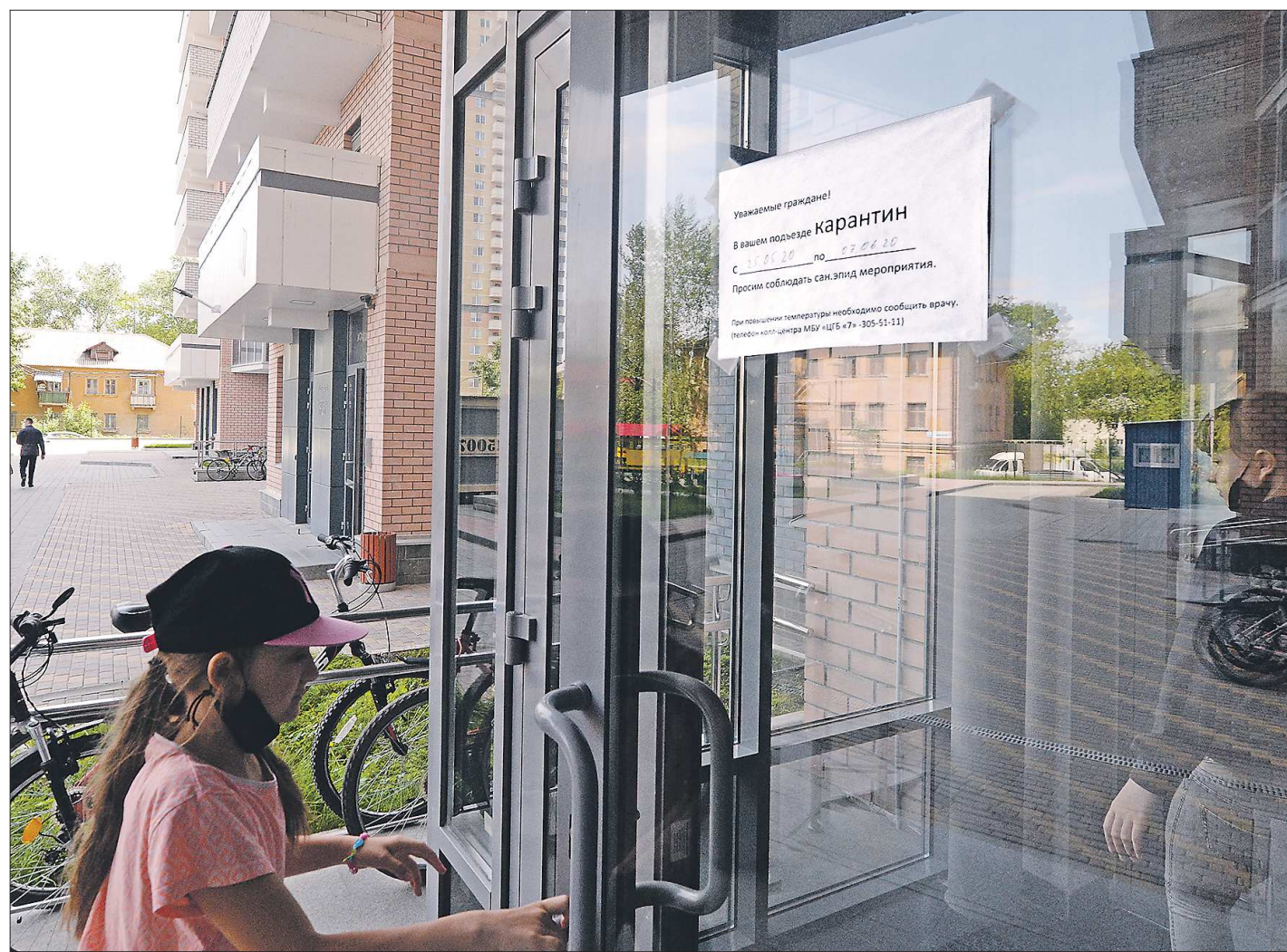
Карантин в жилых домах управляющие компании объявлять не вправе