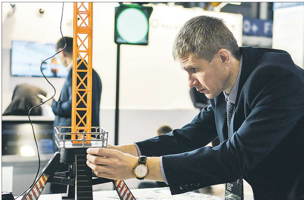
МСП будут поддерживать по 2021 год включительно, а в отдельных случаях - и по 2023 год

Меры поддержки приведут к образованию выпадающих доходов бюджета городского округа в 2020 году в размере около 20 млн рублей.