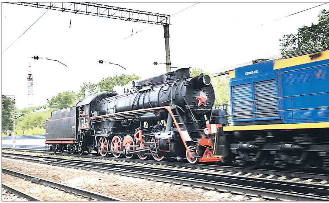
Паровозу Л-4372 уже 66 лет, но он до сих пор способен разогнаться до 90 километров в час

На станции Екатеринбург-Сортировочный жители Екатеринбурга приметили действующий паровоз. Старинное чудо техники проводит манёвры, пыхит, выпускает пар.