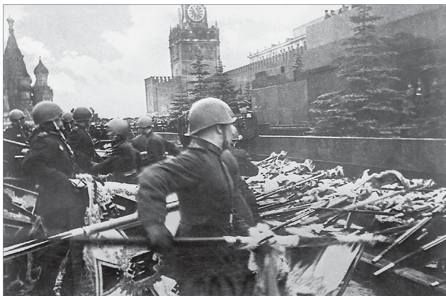
Участники Парада Победы 24 июня 1945 года бросают фашистские знамёна к подножию Мавзолея В.И. Ленина

Вчера Президент России Владимир Путин во время видеоконференции с министром обороны РФ Сергеем Шойгу назвал дату проведения военного парада на Красной площади в честь 75-летия Победы в Великой Отечественной войне. «Мы сделаем это 24 июня – в день, когда в 1945 году состоялся легендарный, исторический парад победителей», – сказал президент. По словам главы государства, такое решение принято с учётом стабилизации ситуации с коронавирусом в стране