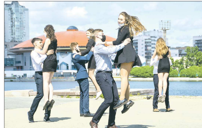
11-классники станцевали выпускной вальс на Октябрьской площади в Екатеринбурге