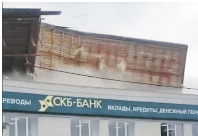
В Арамиле кусок крыши, сорванный сильным ветром с двухэтажного здания по улице 1 Мая, стал причиной гибели мужчины

В минувший понедельник уральцам пришлось остаться дома не только из-за коронавируса, но и из-за циклона, который прокатился по региону. Штормовой ветер срывал кровлю со зданий, укладывал столбы с линиями электропередачи и валил деревья. Не обошлось без жертв. В общей сложности от урагана пострадали 120 населённых пунктов в 23 свердловских муниципалитетах. Сейчас в территориях устраняют последствия стихии.