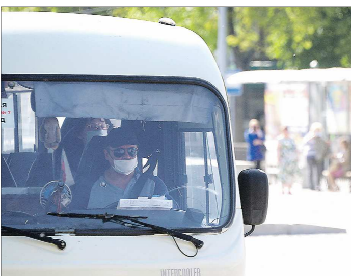
Многие пассажирские автоперевозчики обеспечивают своих сотрудников масками и проводят санобработку салонов автобусов за свой счёт

На междугородье у меня работают 25 машин по направлению «Нижний Тагил - Екатеринбург».