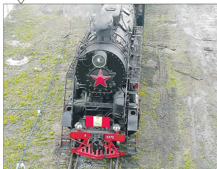
На станции Екатеринбург-Сортировочный жители города приметили действующий паровоз. Старинное чудо техники проводит манёвры, пылит, выпускает пар. Впереди – пятиконечная красная звезда, под ней – цветное изображение Сталина. «Областная газета» решила выяснить, что паровоз делает в городе и откуда он взялся

«По Екатеринбургу ходит паровоз выпуска середины прошлого века»