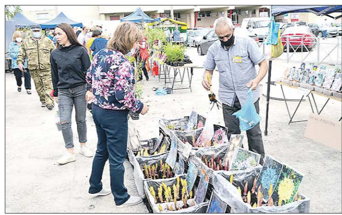
Традиционная ярмарка в Сысерти. В этом году все продавцы стоят в масках и на расстоянии друг от друга

Так же рассуждают и жители уральской столицы. Тем более что некоторые парки были открыты в Екатеринбурге офи-