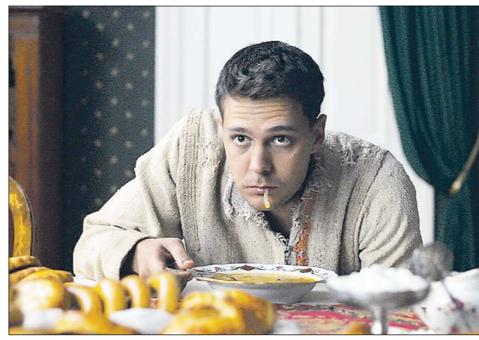
«Холоп» вышел в конце 2019 года и основные его сборы пришлось на 2020-й