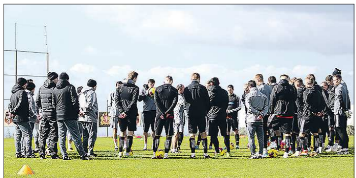
«Урал» готовится возобновить общие тренировки в Екатеринбурге