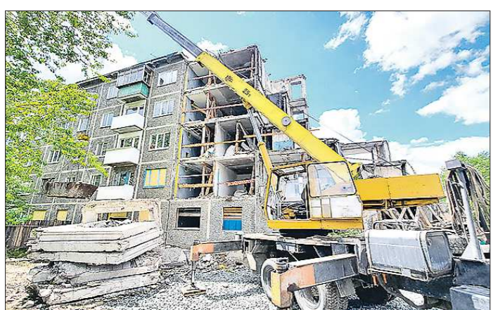
В доме также отремонтируют кровлю и заменят выходы на крышу

Подготовлено в соответствии с критериями, утверждёнными приказом Департамента информационной политики Свердловской области от 09.01.2018 №1 «Об утверждении критериев отнесения информационных материалов, публикуемых государственными учреждениями Свердловской области, в отношении которых функции и полномочия учредителя осуществляет Департамент информационной политики Свердловской области, к социально значимой информации».