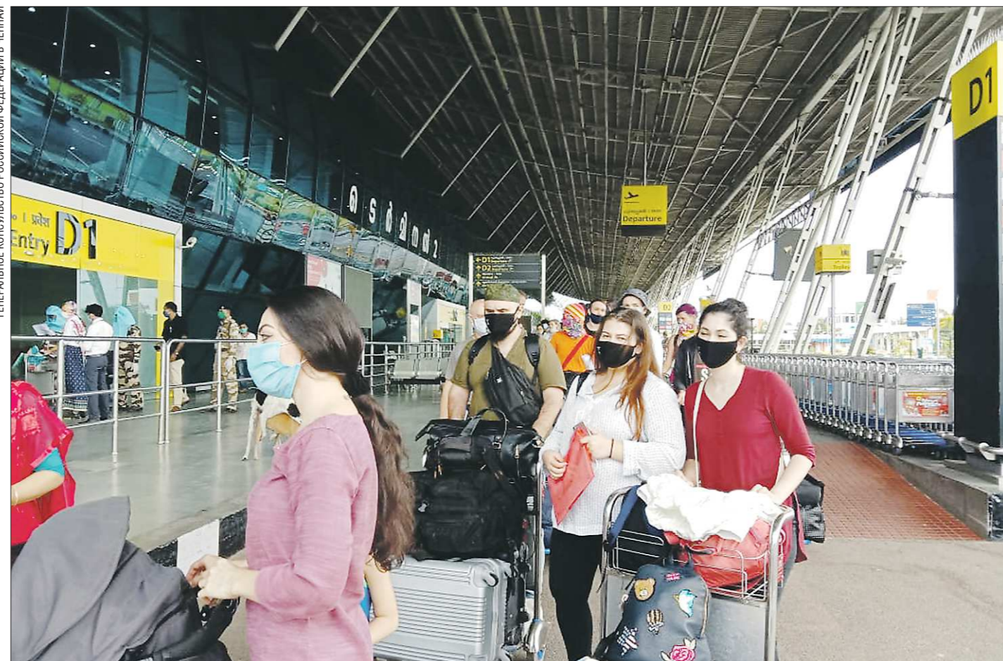
Международный аэропорт Тривандрум, штат Керала в Индии. Возвращения домой ждут 103 туриста, среди которых 13 детей. Следующая остановка самолёта - Калькутта. Затем - Екатеринбург. Конечный пункт - Москва

В Екатеринбург вернулась группа туристов, застрявших в Индии из-за пандемии