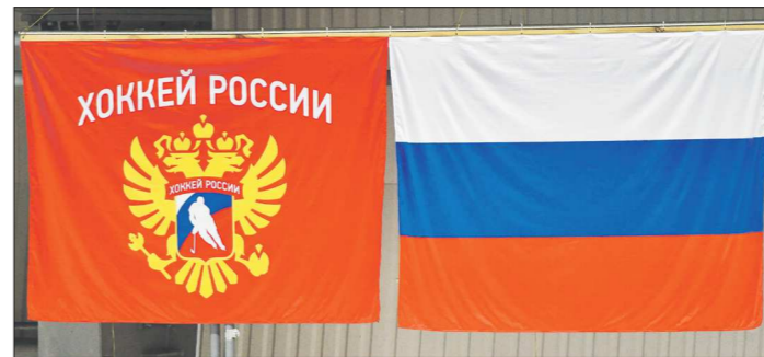
На групповом этапе «Красная машина» проведёт все матчи в Минске

Предварительные группы были известны ранее. Согласно рейтингу ИИХФ, сборная России попала сначала в группу «В». Позднее появилась информация, что федерация поменяет места в группах России и Канаду, чтобы наша команда все свои матчи на групповом этапе проводила в Минске.