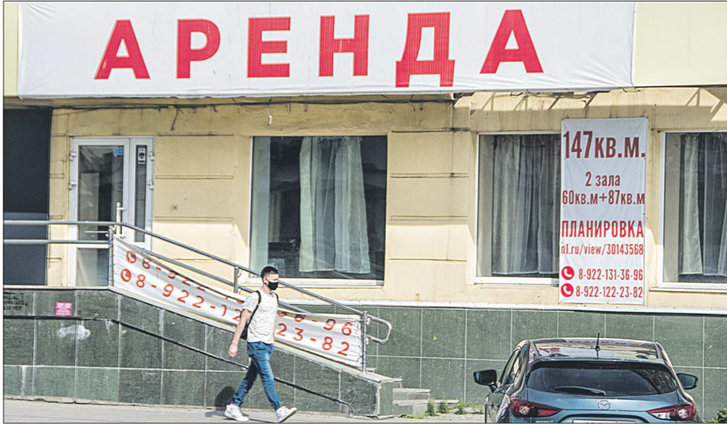
Из-за коронавируса некоторым отраслям в Свердловской области запрещено осуществлять свою деятельность. Поэтому многие помещения простаивают