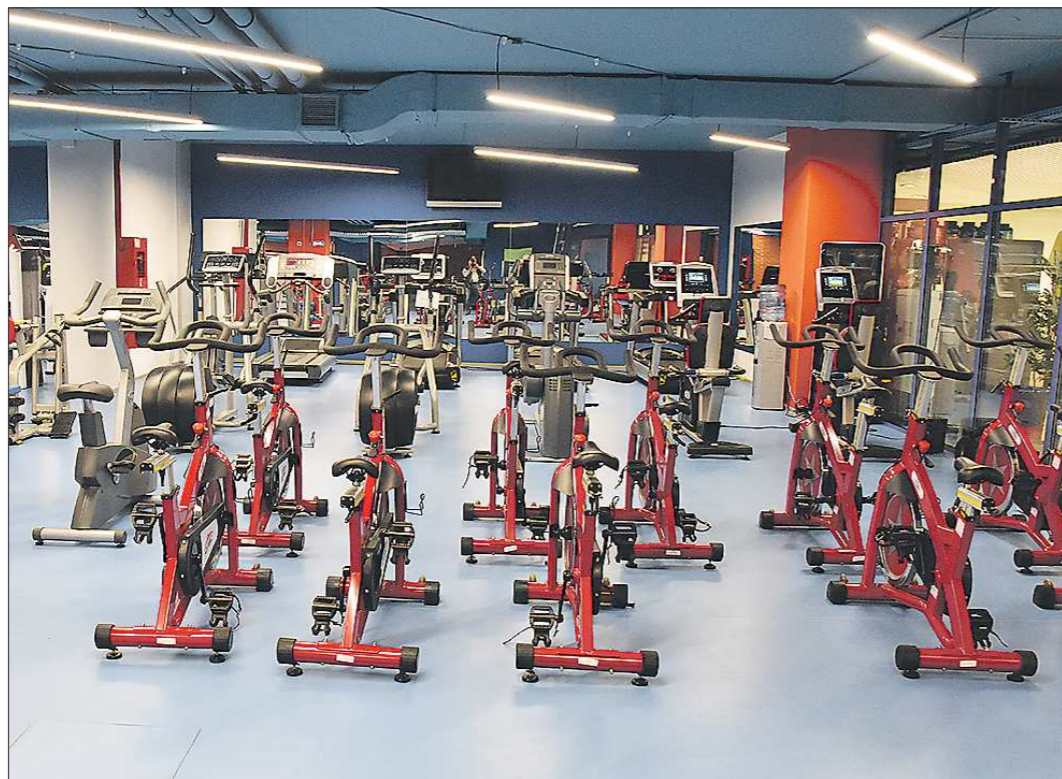
Тренажёры простаивают уже второй месяц