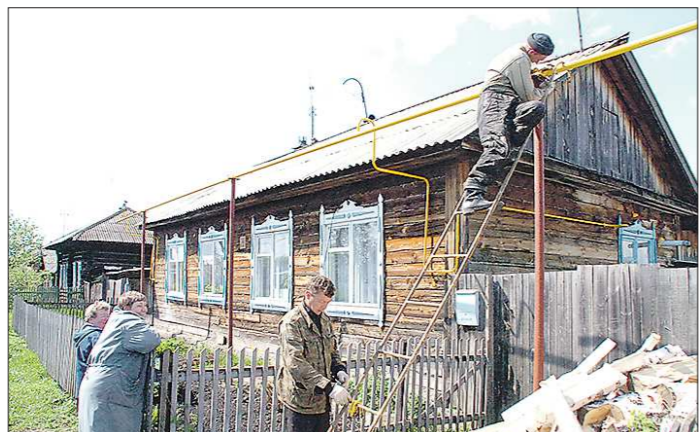
За лето в сельских поселениях стараются решить коммунальные проблемы. И в первую очередь – провести газ к домам

Коронавирус изменил жизнь не только уральских городов, но и сёл. Как выяснила «Областели», из-за пандемии в сельских поселениях региона затормозились многие проекты. К началу лета сельские главы рассчитывали приступить к ремонтно-строительным работам на территориях (предварительно завершив электронные аукционы и заключив договоры с подрядчиками), но эпидемиологическая ситуация внесла свои коррективы.