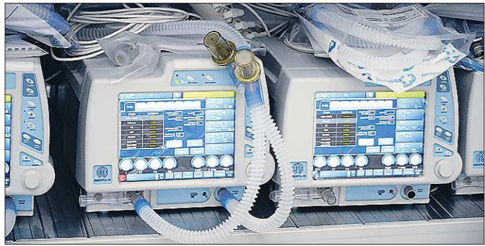
После пожаров в больницах Росздрава надзор приостановил применение в России аппаратов ИВЛ «Авента-М», произведённых с 1 апреля 2020 года