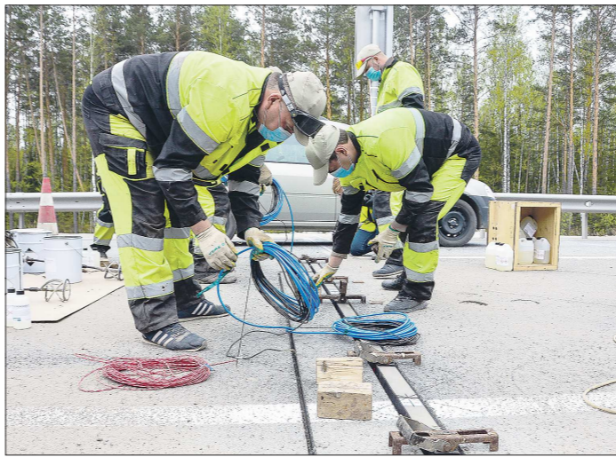
«Хитрые» весы подключают к электронной системе, которая будет передавать в Уралуправтодор и ГИБДД информацию о нарушениях весовых ограничений для большегрузов

На дорогах Свердловской области до конца лета появятся 8 автоматических пунктов весового и габаритного контроля для грузовых автомобилей. Цена контракта составляет 459,3 млн рублей. Работы ведутся в рамках нацпроекта «Безопасные и качественные автомобильные дороги», с целью сохранить дорожное полотно в нормативном состоянии как можно дольше.