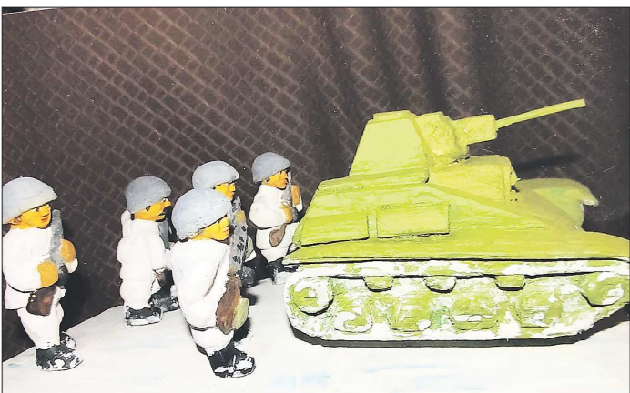
На фото - деревянная композиция «Операция «Искра», посвящённая прорыву блокады Ленинграда