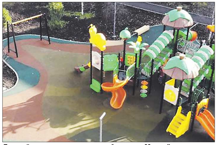
Детский городок – только часть большого Молодёжного сквера в Североуральске