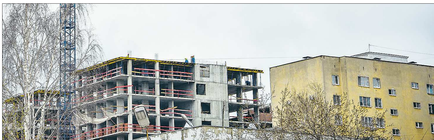
Очевидно, в ближайшее время покупатели квартир окажутся перед выбором: вложиться в жильё на стадии строительства, рискуя, что сроки сдачи затянутся, либо приобрести квартиру на «вторичке»

Подготовлено в соответствии с критериями, утверждёнными приказом Департамента информационной политики Свердловской области от 09.01.2018 №1 «Об утверждении критериев отнесения информационных материалов, публикуемых государственными учреждениями Свердловской области, в отношении которых функция и полномочия учредителя осуществляет Департамент информационной политики Свердловской области, к социально значимой информации».