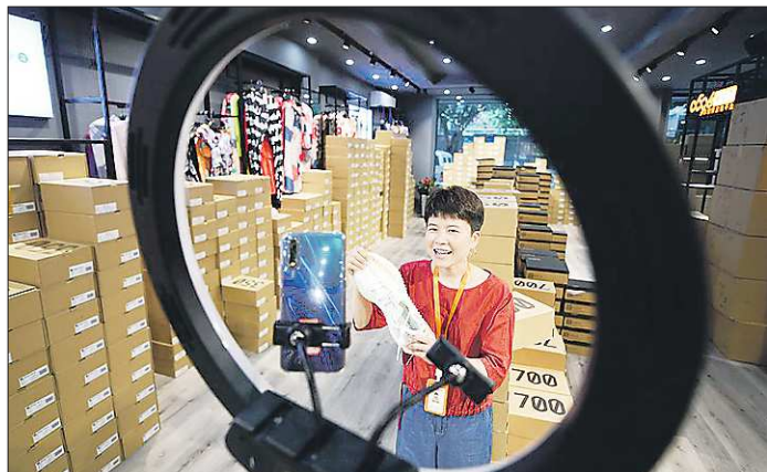
Персонал обувной фабрики продаёт ботинки в прямом эфире на складе электронной коммерции в китайском городе Путяне

Подготовлено в соответствии с критериями, утвержденными приказом Департамента информационной политики Свердловской области от 09.01.2018 №1 «Об утверждении критериев отнесения информационных материалов, публикуемых государственными учреждениями Свердловской области, в отношении которых функции и полномочия учредителя осуществляет Департамент информационной политики Свердловской области, к социально значимой информации».