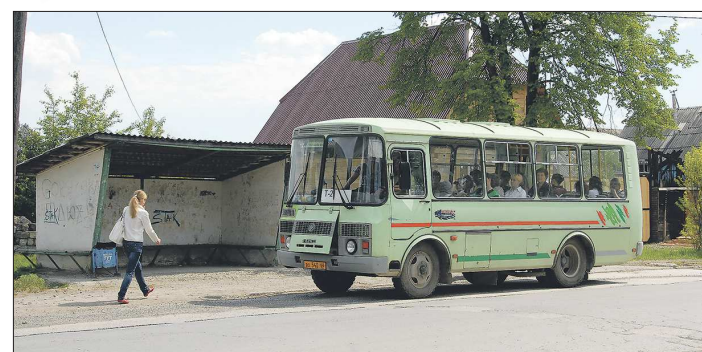
Теперь добраться до Сысерти жителям Двуреченска стало сложнее