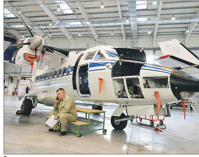
Эксперты считают, что транспортная отрасль снова встанет «на крыло» лишь к 2023 году

Самолёты сегодня больше времени проводят на земле, при этом падают заказы в авиационной промышленности и вслед за ней – у компаний-поставщиков титановой продукции. Одним из