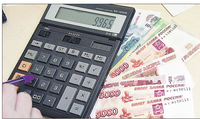
В апреле Свердловская область заняла четвертое место среди субъектов по количеству выданных кредитов. Средний Урал опередили Москва, Московская область и Башкортостан