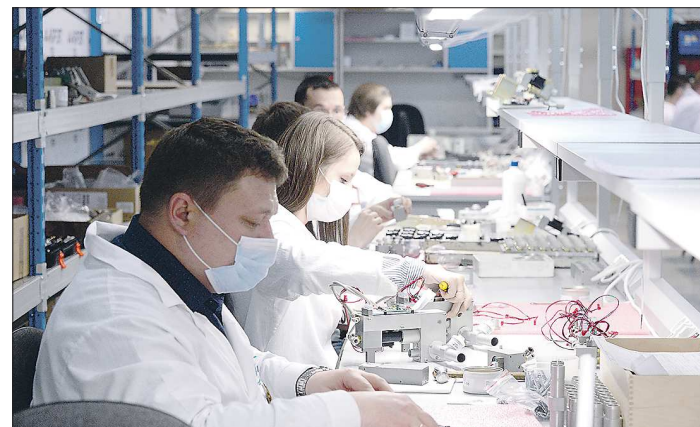
Среди требований Роспотребнадзора к работающим предприятиям – обеспечение сотрудников масками и антисептиками, соблюдение дистанции между работниками, измерение им температуры и проветривание помещений