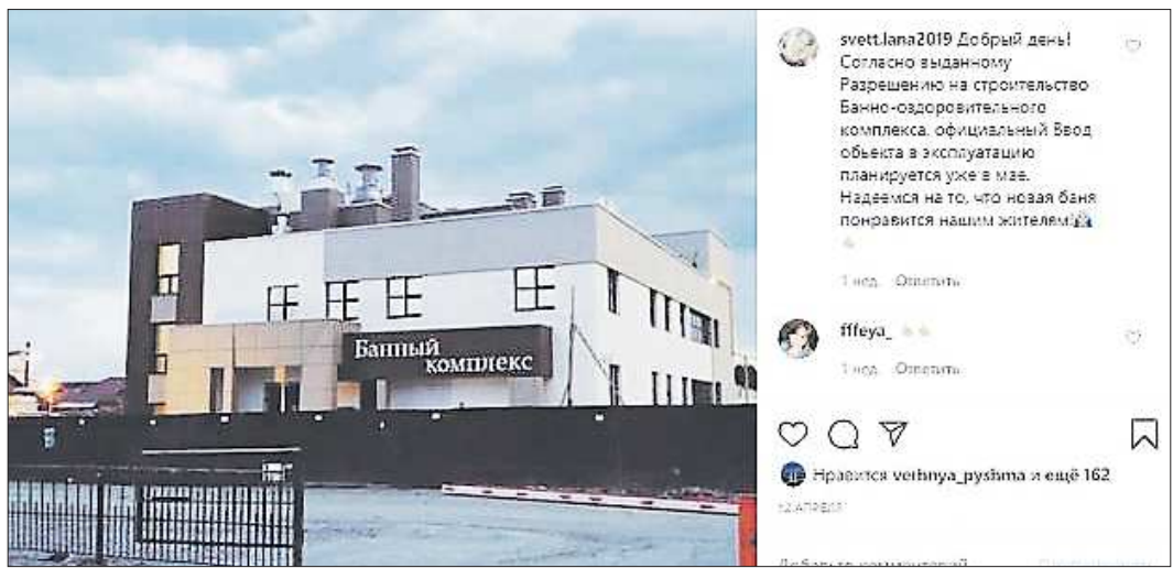
Новый банный комплекс в Верхней Пышме внешне чем-то напоминает торговый центр

Подготовлено в соответствии с критериями, утверждёнными приказом Департамента информационной политики Свердловской области от 09.01.2018 №1