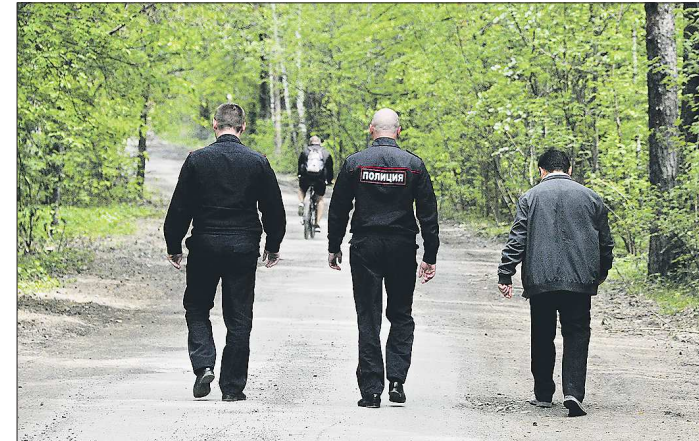
Теперь в Шарташском лесопарке можно заниматься пробежками и просто гулять, соблюдая социальную дистанцию

городской больницы. Вероятно, перерасчёт доплат медикам делали во многих медучреждениях региона. Я работаю на подстанции скорой помощи, которая не занимается приёмом больных коронавирусом, поэтому получил только 15 000 рублей из регионального бюджета.