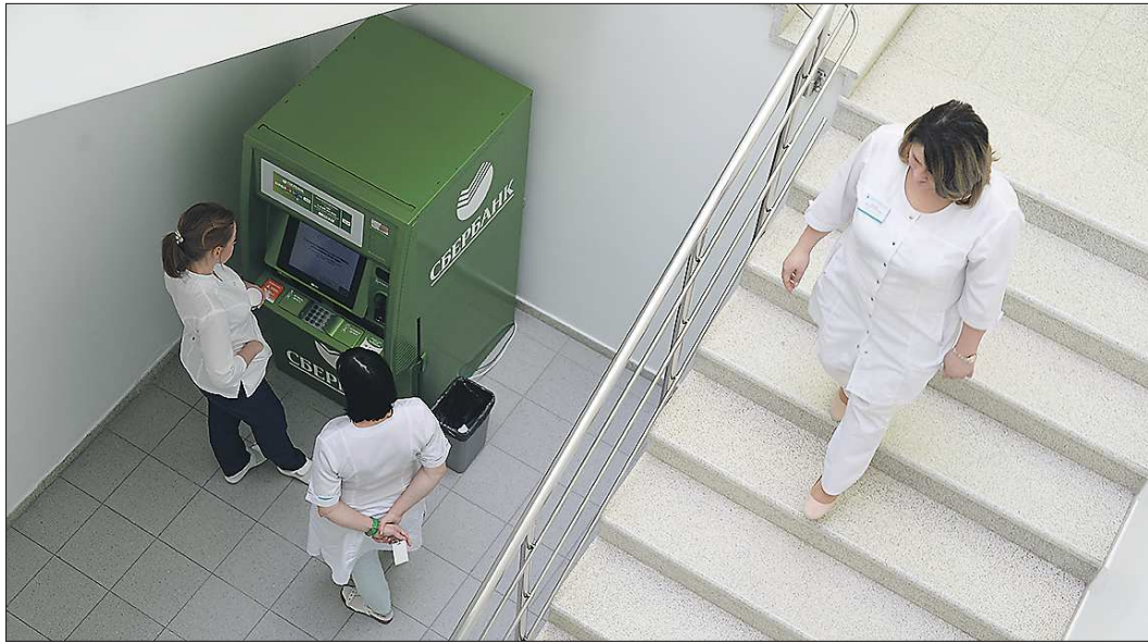
Некоторые медицинские работники получили дополнительные выплаты сразу в полном объёме. Но вполне возможно, что кому-то сделали неверный перерасчёт

В начале апреля президент России Владимир Путин в своём обращении к жителям страны сообщил, что всех медицинских работников, которые оказывают медицинскую помощь больным коронавирусом, ждут дополнительные выплаты к заработной плате из федерального бюджета.