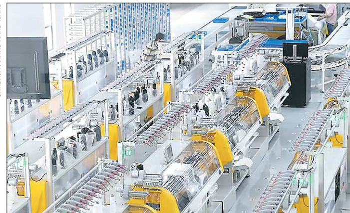
Автоматическая производственная линия специализированной мастерской на фабрике спортивной обуви