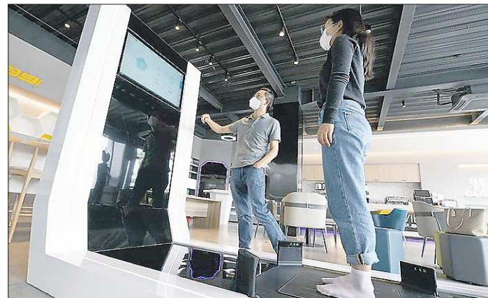
Клиент измеряет свои ноги на умном устройстве производителя спортивной обуви SEMS в Путяне