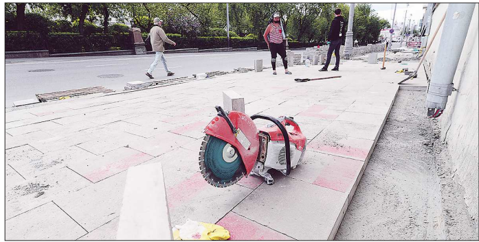
Красная линия возле Театра музкомедии превратилась в «красные кусочки», но рабочие говорят, что её будут смывать и рисовать заново. Вопрос – когда?