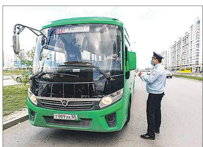
Сотрудники ГИБДД предупреждают кондукторов и водителей о необходимости не допускать «бесмасочных» пассажиров до поездов, но алгоритма действий в таких случаях нет

Муниципальная транспортная инспекция совместно с комитетом по транспорту мэрии и ГИБДД с 10 мая начали проверять соблюдение масочного режима в общественном транспорте уральской столицы.