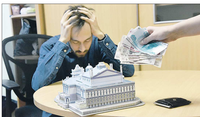
Российское правительство постановило выделить на выплату субсидий 81,1 млрд рублей. Некоторые предприниматели уже на днях начнут получать деньги

«Облгазета» продолжает серию материалов о том, каким образом разные категории граждан и пострадавшие от коронавируса предприниматели могут воспользоваться федеральными мерами поддержки.