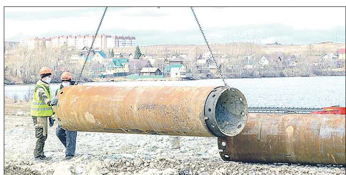
Путепровод будет базироваться на восьми опорах, шесть из них установят в воде