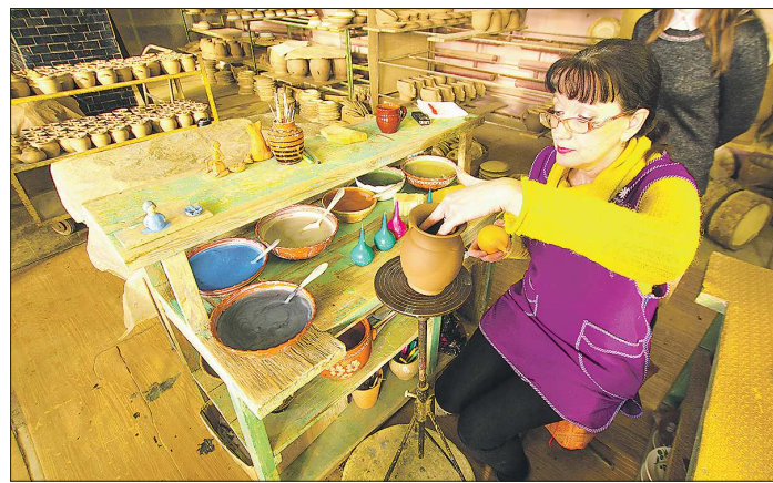
Первые глазури на Урале появились в середине XVIII века, а продолжают эту традицию нынешние мастера предприятия «Таволжская керамика»