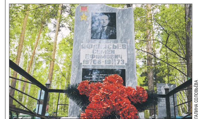
Новый памятник для Героя Советского Союза Семёна Афанасьева обошёлся примерно в 70 тысяч рублей

Подготовлено в соответствии с критериями, утвержденными приказом Департамента информационной политики Свердловской области от 09.01.2018 №1 «Об утверждении критериев отнесения информационных материалов, публикуемых государственными учреждениями Свердловской области, в отношении которых функции и полномочия учредителя осуществляет Департамент информационной политики Свердловской области, к социально значимой информации».