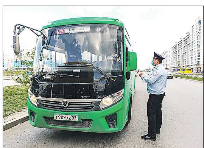
Сотрудники ГИБДД предупреждают кондукторов и водителей о необходимости не допускать «безмасочных» пассажиров до поездов, но алгоритма действий в таких случаях нет

Муниципальная транспортная инспекция совместно с комитетом по транспорту мэрии и ГИБДД с 10 мая начали проверять соблюдение масочного режима в общественном транспорте уральской столицы.