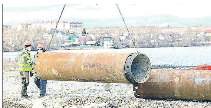
Путепровод будет базироваться на восьми опорах, шесть из них установят в воде