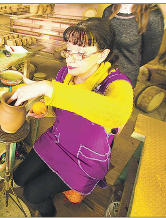
Первые глазури на Урале появились в середине XVIII века, а продолжают эту традицию нынешние мастера предприятия «Таволжская керамика»