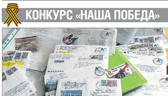
На конкурс «Наша Победа» редакция получила сотни писем – как по электронной почте, так и «Почтой России»