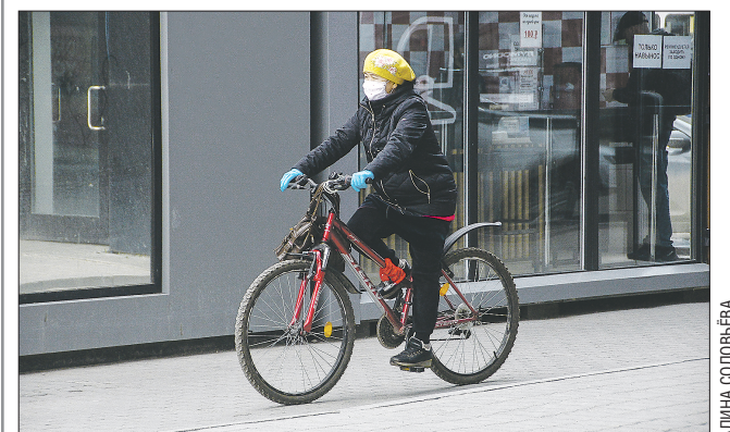
Уральцы продолжают соблюдать масочный режим и при постепенном снятии ограничительных мер

Подготовлено в соответствии с критериями, утвержденными приказом Департамента информационной политики Свердловской области от 09.01.2018 №1 «Об утверждении критериев отнесения информационных материалов, публикуемых государственными учреждениями Свердловской области, в отношении которых функции и полномочия учредителя осуществляет Департамент информационной политики Свердловской области, к социально значимой информации»