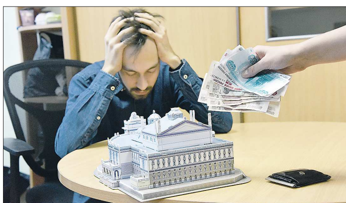
Российское правительство постановило выделить на выплату субсидий 81,1 млрд рублей. Некоторые предприниматели уже на днях начнут получать деньги

«Облгазета» продолжает серию материалов о том, каким образом разные категории граждан и пострадавшие от коронавируса предприниматели могут воспользоваться федеральными мерами поддержки.