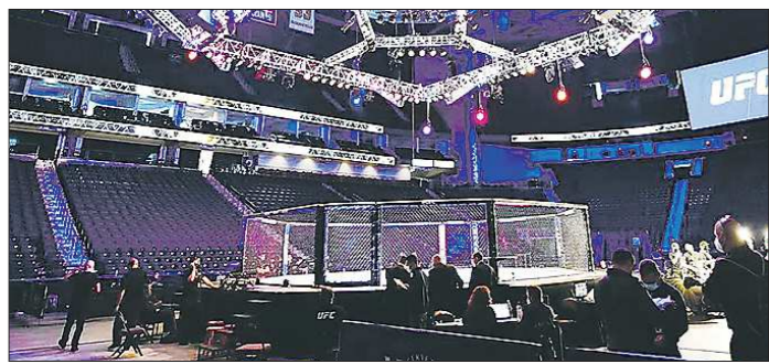
Так выглядел пустой зал во время турнира UFC 249