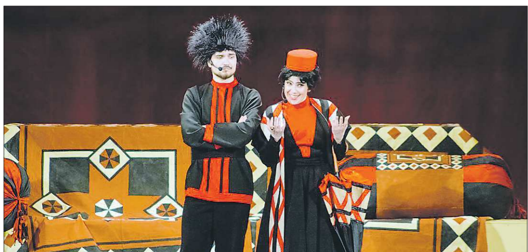
Сцена из обновлённого спектакля «Ханума» новоуральского Театра музыки, драмы и комедии

Подготовлено в соответствии с критериями, утверждёнными приказом Департамента информационной политики Свердловской области от 09.01.2018 №1 «Об утверждении критериев отнесения информационных материалов, публикуемых государственными учреждениями Свердловской области, в отношении которых функции и полномочия учредителя осуществляет Департамент информационной политики Свердловской области, к социально значимой информации».