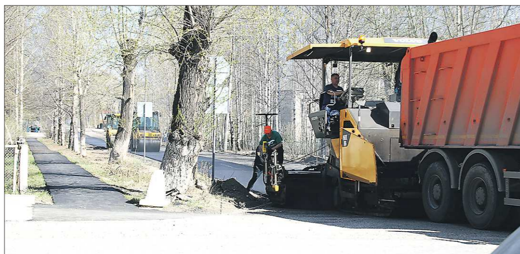
В Серове сначала отремонтируют дороги, по которым проходят автобусные маршруты

Всего за строительный сезон тагильчанам предстоит привести в порядок 22 объекта общей протяжённостью более 30 километров. КАЧКАНАР. Мэрия подписала контракт на реконструкцию улицы Энтузиастов – одной из основных качканарских магистралей. Цена вопроса – 97 миллионов рублей. Длина дороги составляет 1,7 километра, ширина – 8 метров, ширина тротуара – 2,25 метра. Срок службы нового покрытия 15 лет. На до-