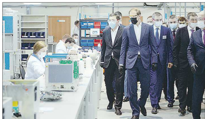
Денис Мантуров (в чёрной маске) и Евгений Куйвашев (слева) приехали на УПЗ в масках, перчатках и защитных очках

Оперативный штаб Свердловской области сообщил, что спецрежим в регионе действует до особого распоряжения