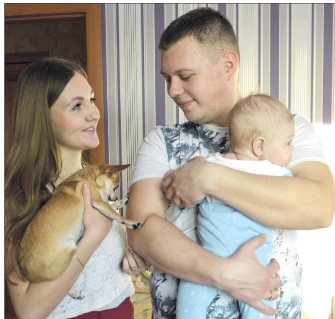
Все семьи с детьми до трёх лет могут получить 5 000 рублей каждый месяц с апреля по июнь – для этого достаточно отправить заявку на сайтах ПФР или госуслуг

В Свердловской области родители, чьи дети бесплатно питаются в школе, вместо этого получили возможность денежных выплат. Однако для перечисления на счёт средств не нужно нарушать режим самоизоляции: достаточно отправить заявку по электронной почте в адрес администрации школы, где учатся дети. В апреле родители деньги вместо питания уже получили. В мае выплаты для семей с детьми льготных категорий (многодетные семьи, дети-сироты и оставшиеся без попечения родители, а также семьи, чей среднедушевой доход ниже величины прожиточного минимума) пройдут по той же схеме – учиться очно школьники в этом учебном году уже не будут.