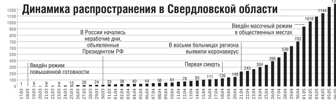
Динамика распространения в Свердловской области

– К сожалению, не всегда информация от работодателя оперативно поступает в Пенсионный фонд. Сейчас профильными ведомствами прорабатываются изменения в закон об индивидуальном персональном учёте, обязывающие работодателя предоставлять информацию уже на следующий день после подписания приказа об увольнении. Вам же советуем фото справки и записи в трудовой об увольнении направить в Артёмовский центр занятости через наш портал szn-ural.ru . Авторизовавшись на нём можно через госуслуги, а в списке услуг выбрать пункт «Прикрепить документы». После этого рекомендуем вашему супругу связаться с центром для подробной и предметной консультации.