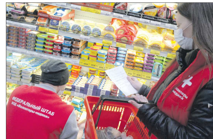
Самая популярная услуга, за которой обращаются к волонтерам, конечно же, закупка и доставка продуктов и медикаментов. Но в некоторых городах добровольцы готовы помочь и с бытовыми проблемами

С 18 марта Штаб Общероссийского народного фронта (ОНФ) и волонтеров-медиков по координации помощи пожилым и маломобильным гражданам, находящимся в самоизоляции, попавшим в группу риска из-за распространения COVID-2019, запустил горячую линию по поддержке и координации помощи пожилым людям и маломобильным гражданам. Кол-центр работает в круглосуточном режиме.