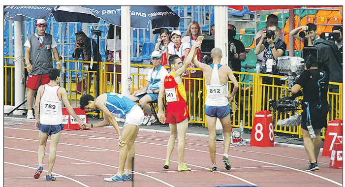
Чемпионат мира с 2021 года перенесли на 2022-й. Чемпионат Европы отменили. Совсем