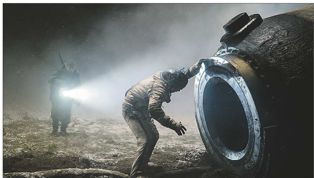
Конечно, «Спутник» был расчитан на большой экран. Но сейчас любой зритель сможет посмотреть историю о космонавте Вешнякове не выходя из дома