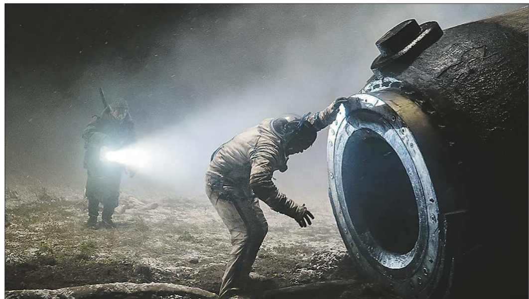
Конечно, «Спутник» был расчитан на большой экран. Но сейчас любой зритель сможет посмотреть историю о космонавте Вешнякове не выходя из дома