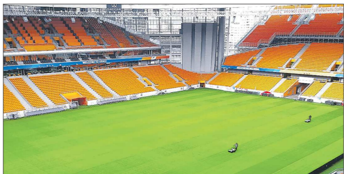
«Екатеринбург Арена» уже давно не принимает матчи, однако за газом продолжают тщательно следить. Поле готово для продолжения сезона

Руководства российской футбольной премьер-лиги (РПЛ) и российского футбольного союза (РФС) встретились с представителями клубов. На заседании обсуждались вопросы возможного возобновления сезона.