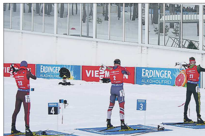
Из-за коронавируса у биатлонистов отдых начался раньше. Но в СБР продолжают кипеть страсти