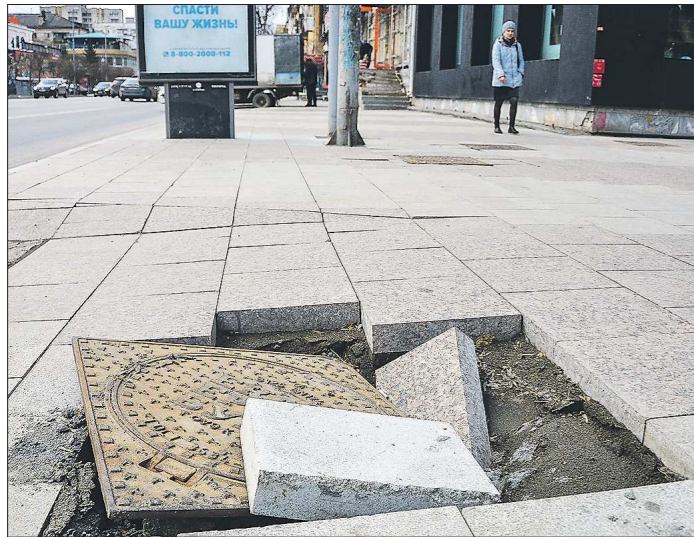
Люк с разбитой плиткой на перекрёстке Малышева – Бажова