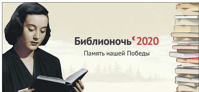
Библионочь 2020 Память нашей Победы

В год 75-летия Победы традиционная библиотечная акция была посвящена теме Великой Отечественной войны