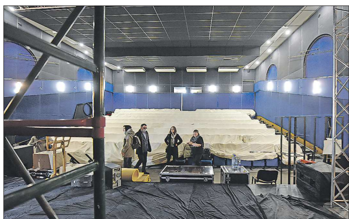
Столетие спустя в этом зале снова появятся театральные декорации

Подготовлено в соответствии с критериями, утвержденными приказом Департамента информационной политики Свердловской области от 09.01.2018 №1 «Об утверждении критериев отнесения информационных материалов, публикуемых государственными учреждениями Свердловской области, в отношении которых функции и полномочия учредителя осуществляет Департамент информационной политики Свердловской области, к социально значимой информации».