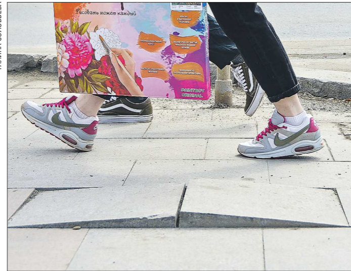
На Мамина-Сибиряка – Ленина «оттаял» тротуарный «домик»