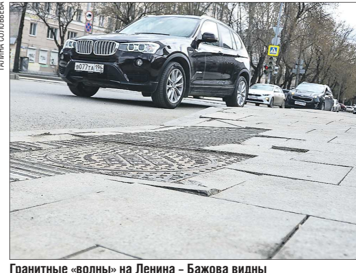
Гранитные «волны» на Ленина – Бажова видны невооружённым глазом