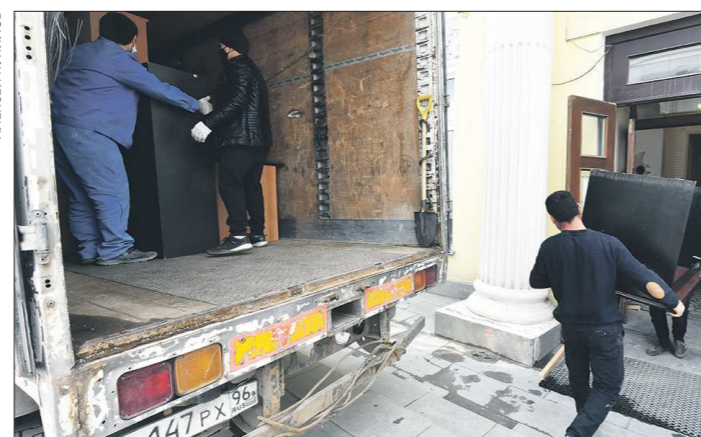
Какое новоселье без хлопотной процедуры переезда

Уже 6 мая театр планировал открыть новую для себя сцену, но теперь открытие перенесли на 16 июня. Если всё будет благополучно, то в этот день пройдёт премьера спектакля «Уси-лебедин», уже жанр которого — душевная сказка — выглядит заманчиво. Пока же