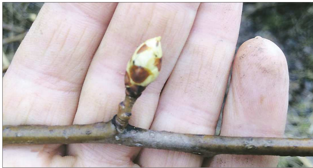
Размеры плодовой почки говорят о том, что дерево готово к цветению

Конечно. На закладке урожая этого года, например, сказались погодные факторы даже 2018 года, повлиявшие на эти культуры, хотя в принципе наши уральские сорта в стандартные по погоде годы выраженной периодичностью плодоношения не отличались. Они каждый год дают стабильный урожай. Но произошли какие-то климатические изменения, и мы видим, что это сказывается на пло-