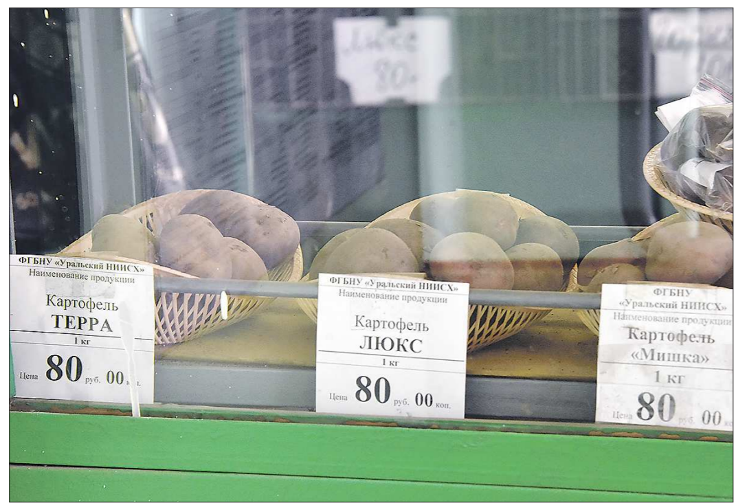
Конец апреля – лучшее время для приобретения семенного картофеля. Цена новых сортов – в пределах 100 рублей за килограмм

Довольно часто на розах встречаются и листогрызущие вредители. Это преимущественно минеры – мелкие мухи или мошки размером два-три сантиметра. Они прогрызают листья и откладывают в них яйца, из которых вылупляются личинки и начинают грызть ходы внутри листьев. В результате на них появляются пятна и светлые полосы. Если паразитов вовремя не уничтожить, то листья желтеют, высыхают и отмирают. Любят вредить розам и пчелы-листорезы. Своими сильными челюстями они вырезают на поверхности листьев кружочки или другие фигуры, которые затем используют, чтобы выстилать ячейки своих гнёзд. Но особо бояться листорезов не стоит: большого вреда розам они нанести не могут. Как правило, одной обработки инсектицидами хватает, чтобы надолго прогнать их с участка.