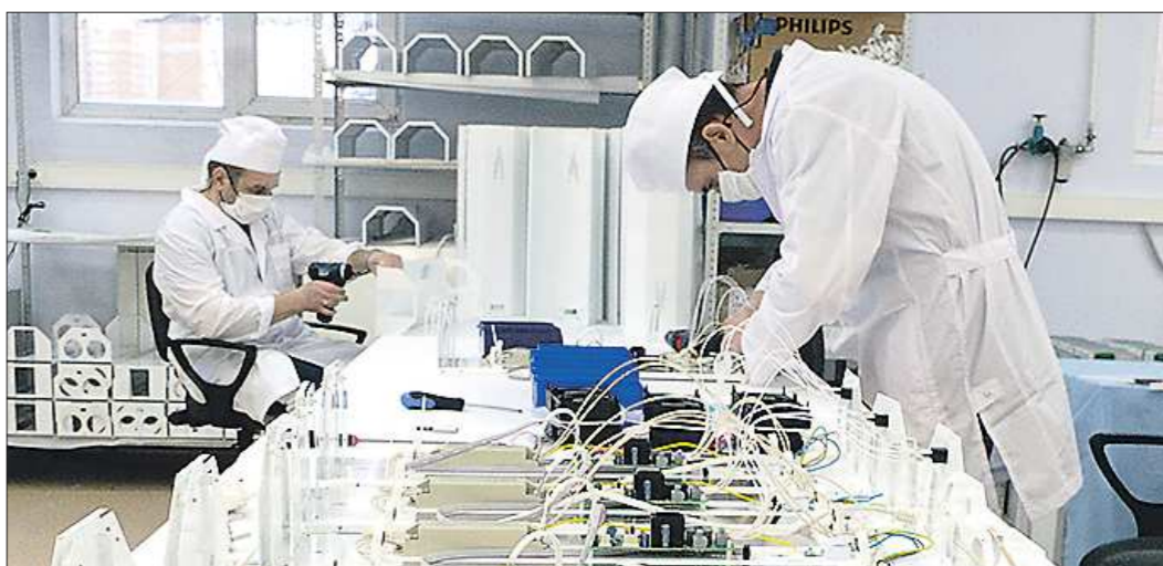
Для производства приборов на заводе организована дополнительная линия сборки и расширен штат сотрудников

Подготовлено в соответствии с критериями, утверждёнными приказом Департамента информационной политики Свердловской области от 09.01.2018 №1 «Об утверждении критериев отнесения информационных материалов, публикуемых государственными учреждениями Свердловской области, в отношении которых функции и полномочия учредителя осуществляет Департамент информационной политики Свердловской области, к социально значимой информации».