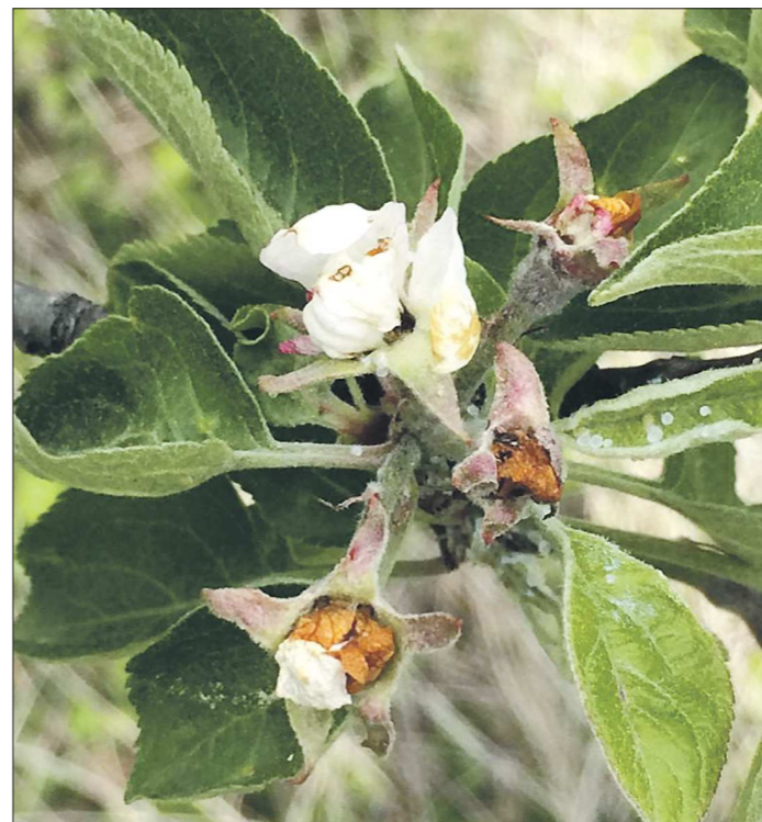
Цветки яблони, поражённые цветоедом, уже не дадут урожай

Наверное, многие замечали, что некоторые бутоны, едва распустившись, становятся коричневыми и засыхают. Их повредил цветоед, отложив внутри личинку, плод из этого цветка уже не сформируется. Одна самка цветоеда может повредить до ста и больше цветков. На селекционной станции были годы, когда во время цветения сады стояли не белые, а коричневые – настолько велико было нашествие этого жука. Кстати, цветоед больше вредит яблоне, потому что груша цветёт раньше и успевает отцвести до того, как появится этот вредитель.