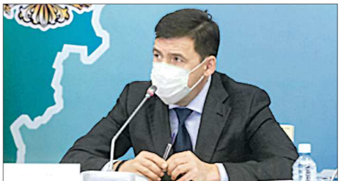
Евгений Куйвашев пообещал продолжить общение с подписчиками

бэнком. Частично, но оплачиваю коммунальные услуги. Сегодня сотрудники УК нашего дома поставили меня в известность, что если не оплачу коммунальные услуги в полном объёме, они отключат электроэнергию. Но мне просто не откуда взять деньги.