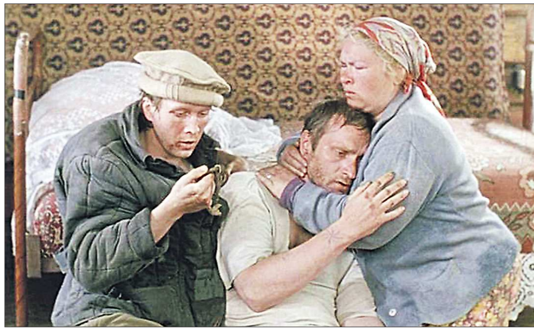
Три главных героя фильма - Коля (слева), его брат Федька и их мать. Нина Усатова и Александр Балуев (в центре) получили награды «Кинотавра» и «Ники». Без призов остался Евгений Миронов...