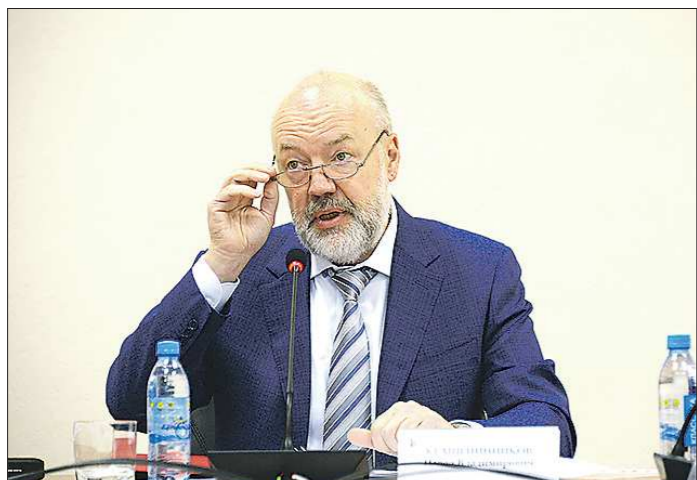
Павел Крашенинников подчеркнул, что поправки уже работали на опережение, и необходимо их правовое закрепление