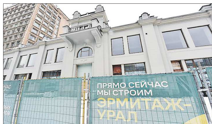
Общая стоимость финансирования проекта «Эрмитаж-Урал» составит порядка 707 млн рублей