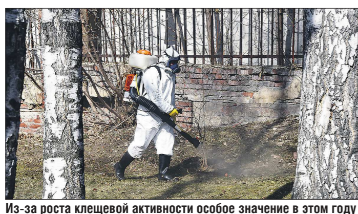
Из-за роста клещевой активности особое значение в этом году приобретает акарицидная обработка

Из-за проблем с коронавирусной инфекцией для многих на второй план ушла другая вирусная напасть — клещевой энцефалит. Но в этом году клещи особенно активны, на Среднем Урале уже появились первые больные с диагнозами клещевой энцефалит и боррелиоза, а счёт людей, пострадавших от кровососущих насекомых, перевалил за тысячу.