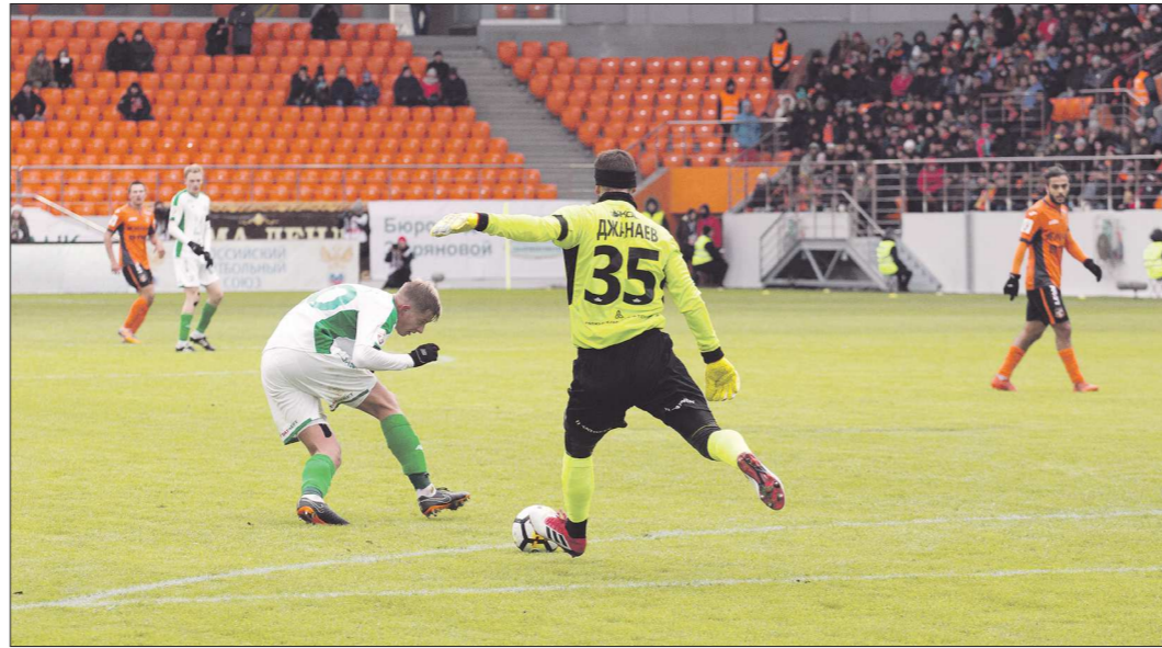
Вряд ли профессиональным спортсменам, в том числе футболистам, удастся вернуться от экономических последствий пандемии коронавируса

По нашей информации, по прошествии трёх недель позиция не изменилась — пока футболисты разъехались по до-