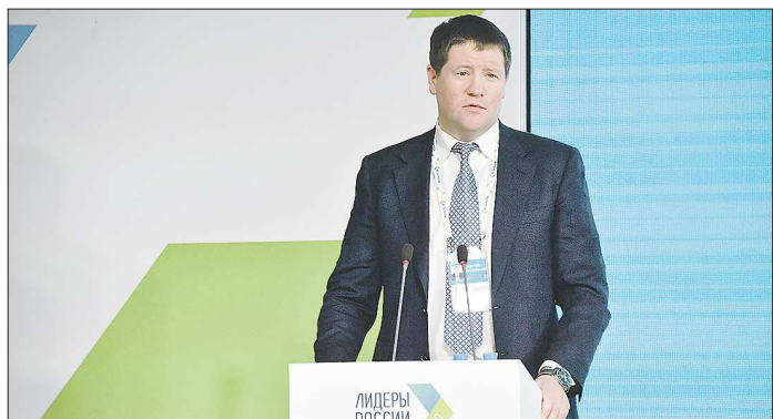
Сергей Бидонко задекларировал самые высокие доходы среди членов правительства Свердловской области