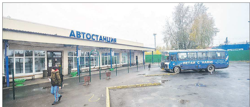
Система позволит получить данные о количестве первоуральцев, которые во время режима повышенной готовности продолжают ездить на работу в другие города

Подготовлено в соответствии с критериями, утвержденными приказом Департамента информационной политики Свердловской области от 09.01.2018 №1 «Об утверждении критериев отнесения информационных материалов, публикуемых государственными учреждениями Свердловской области, в отношении которых функции и полномочия учредителя осуществляет Департамент информационной политики Свердловской области, к социально значимой информации».