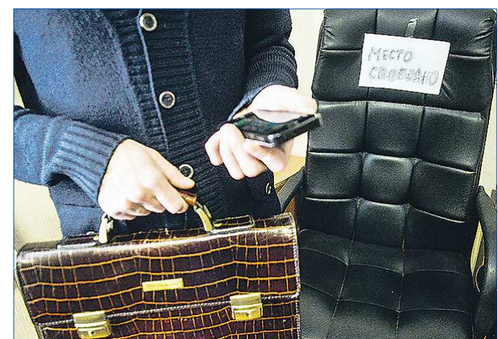
По-прежнему вакантной в регионе остаётся должность главы ЗАТО Свободный

Сменился и глава посёлка Атиг: на смену Сергею Ме-