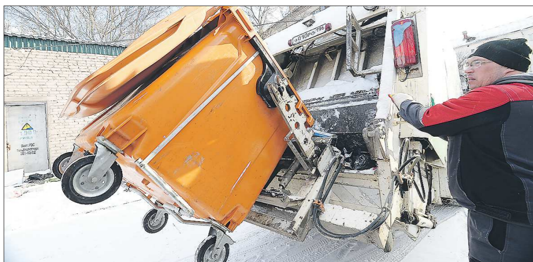
Региональные операторы по обращению с ТКО приступили к работе в этом году в связи с государственной экологической реформой

Подготовлено в соответствии с критериями, утвержденными приказом Департамента информационной политики Свердловской области от 09.01.2018 №1 «Об утверждении критериев отнесения информационных материалов, публикуемых государственными учреждениями Свердловской области, в отношении которых функция и полномочия уполномоченного осуществляет Департамент информационной политики Свердловской области, к социально значимой информации».