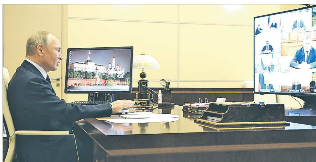
По традиции Владимир Путин провёл совещание в формате видеоконференции. Вступительное слово президента транслировали федеральные телеканалы

Ещё одна мера поддержки, предложенная Владимиром Путиным, коснётся авиатранспорта. Он призвал направить на поддержку авиакомпаний более 23 млрд рублей – на лизинг авиатехники, пополнение оборотных средств, выплату зарплат, оплату стоянки авиатранспорта.