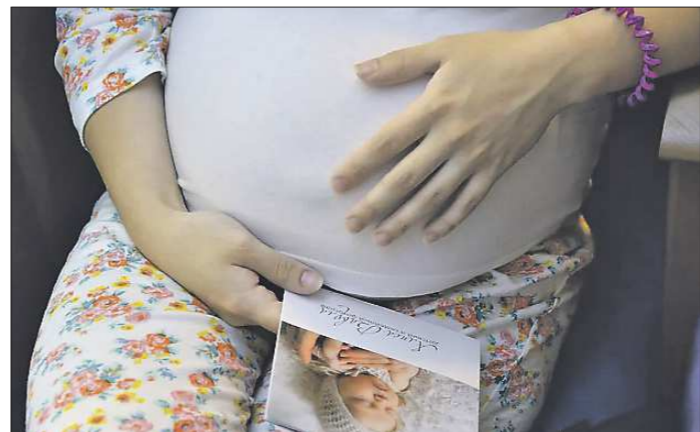
Пенсионный фонд начнет автоматически оформлять маткапитал родителям зарегистрированных в ЗАГСе малышей после 15 апреля

Напомним, ранее председатель оргкомитета ИННОПРОМА, министр промышленности и торговли РФ Денис Мантуров решил перенести выставку на июль 2021 года. Причиной стала неблагоприятная эпидемиологическая обстановка в мире из-за коронавируса. Проект открыл первый за-