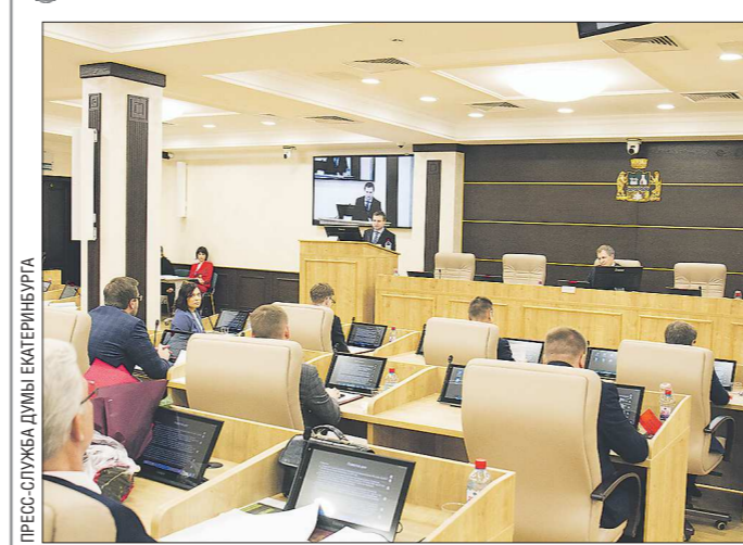
Вчера дума Екатеринбурга провела первое заседание в новом помещении - в здании ЦУМа. Такое решение было принято в связи с ограничительными мерами из-за коронавируса.