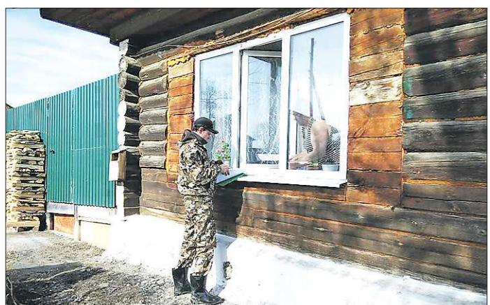
Инструкторы Центра общественной безопасности предупреждают ирбитчан о возможном подтоплении и выдают памятки