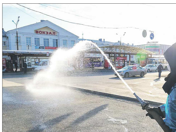
Обработка привокзальной площади в Нижнем Тагиле. Коммунальные службы работают в защитных костюмах

В Ирбитском районе идёт дезинфекция жилых домов и детских садов. К уборке территории от мусора в округе приступили, но со всеми мерами предосторожности, подчеркнул глава Алексей Никифоров.