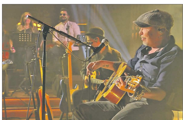
Одним из первых гостей нового шоу стал Гарик Сукачёв

«Линейка акустических концертов звёзд российской музыки. Акустический проект «Вечерний Unplugged» станет крупнейшей концертной площадкой в стране на то время, пока мы