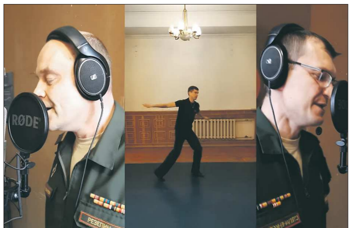
Песню записали в студии Окружного дома офицеров, а танцы сняли в домашних условиях