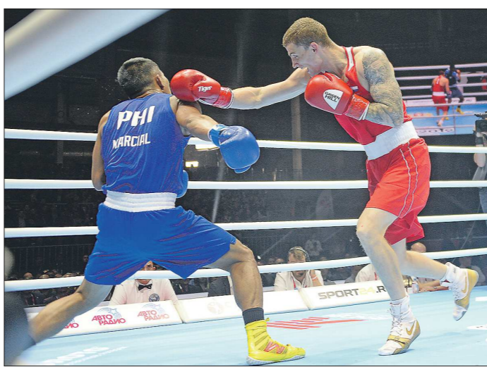
Похоже, что профессиональный спорт, как и многие другие сферы нашей жизни, оказался в нокауте. И пока никто не знает, насколько глубоким он будет

Профессиональный спорт, в отличие от физкультуры, это всё-таки индустрия развлечений. А потехе, как хорошо известно, отмерян свой, далеко не первый по значимости час. Хотя для чего мы живём, ходим на работу, как не для того, чтобы в свободное время развлечься каждый его более приятным образом. Тем не менее вполне понятно и ожидаемо слова федерального министра спорта о том, что меры государственной поддержки должны быть направлены на социальную сферу, а профессиональный спорт не будет являться приоритетом. Похоже, что нынешняя ситуация будет отличаться от той, когда первоочередны-