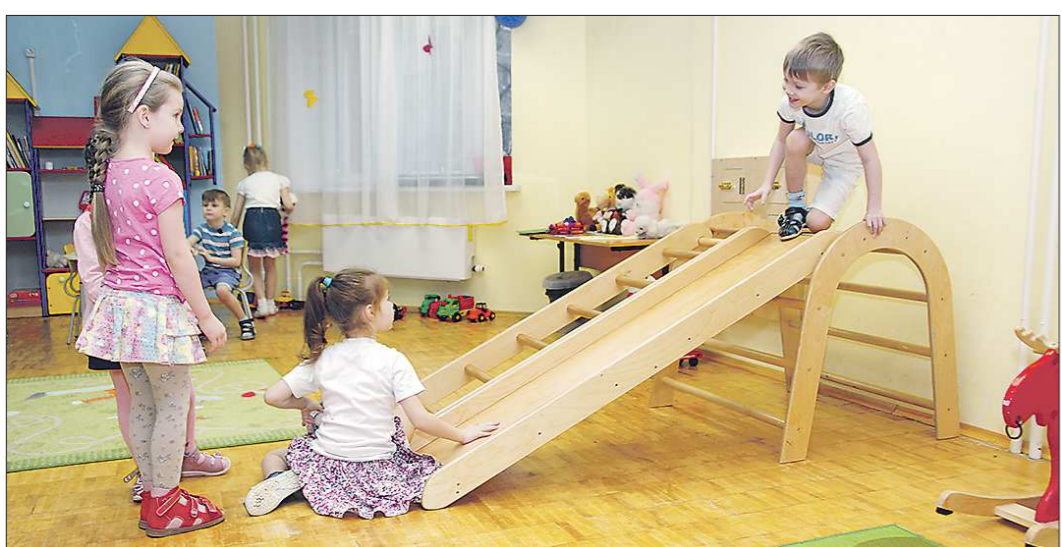
Сейчас в регионе работают только дежурные группы в государственных и частных детсадах

Подготовлено в соответствии с критериями, утвержденными приказом Департамента информационной политики Свердловской области от 09.01.2018 №1 «Об утверждении критериев отнесения информационных материалов, публикуемых государственными учреждениями Свердловской области, в отношении которых функции и полномочия уполномоченного осуществляет Департамент информационной политики Свердловской области, к социально значимой информации».