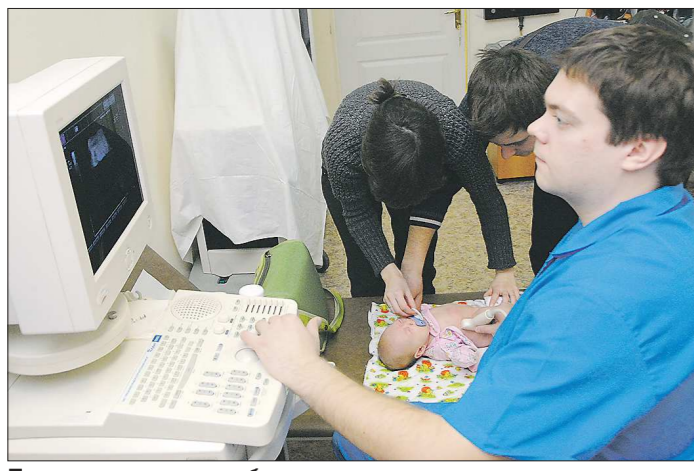
Теперь у сотрудников больницы не должно возникнуть вопросов в расчётах оценки их труда