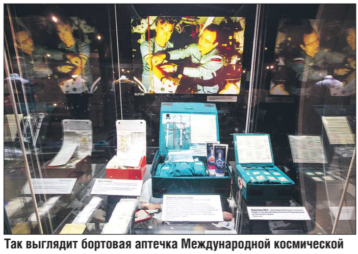
Так выглядит бортовая аптечка Международной космической станции

Накануне Дня космонавтики «Областгазета» решила выяснить, как эпидемия коронавируса повлияла на планы ведущих космических держав по освоению внеземного пространства. Главный вопрос, который волнует многих, - грозит ли коронавирусу нашим космонавтам? Они утверждают, что нет: Россия одной из первых в мире приняла жёсткие ограничения, чтобы не допустить распространения инфекции на орбиту планеты.