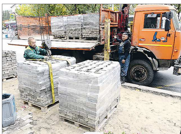
Закупки будут отменены согласно решению главы города

Подготовлено в соответствии с критериями, утверждёнными приказом Департамента информационной политики Свердловской области от 09.01.2018 №1 «Об утверждении критериев отнесения информационных материалов, публикуемых государственными учреждениями Свердловской области, в отношении которых функции и полномочия уполномоченного осуществляет Департамент информационной политики Свердловской области, к социально значимой информации».