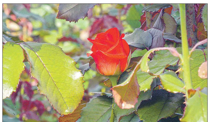
Если соблюдать правильную агротехнику роз, они будут цвести всё лето