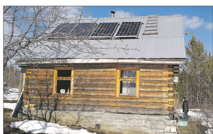
Солнечные панели на крыше дома Мошкиных пережили третью зиму