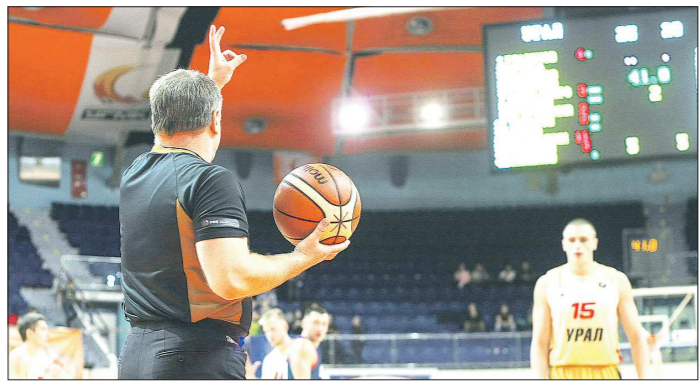
И про спортивных судей, и про официантов вполне можно сказать, что они «обслуживают». Разница лишь в том, что официанту не запрещено получать чаевые

Причина якобы в том, что Карпов до сих пор рефлексирует на тему получения первого чемпионского титула в 1975 году после отказа от матча его предшественника Бобби Фишера. Но ведь позднее, в 1978 и 1981 годах, в матчах с Виктором Корчным Карпов отстоял титул без всяких оговорок.