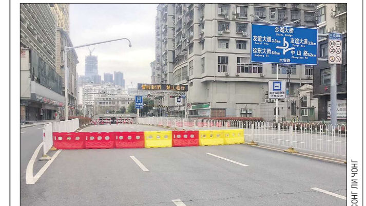
На улицах мегаполиса пока пусто: чтобы выйти из жилого комплекса, придётся объяснить, зачем вам это нужно, на нескольких КПП

Подготовлено в соответствии с критериями, утверждёнными приказом Департамента информационной политики Свердловской области от 09.01.2018 №1 «Об утверждении критериев отнесения информационных материалов, публикуемых государственными учреждениями Свердловской области, в отношении которых функции и полномочия учредителя осуществляет Департамент информационной политики Свердловской области, к социально значимой информации».