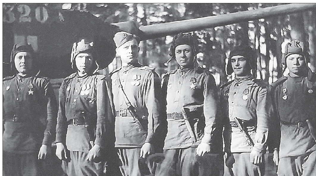
Танкисты Челябинской бригады гвардейской Урало-Львовской дивизии