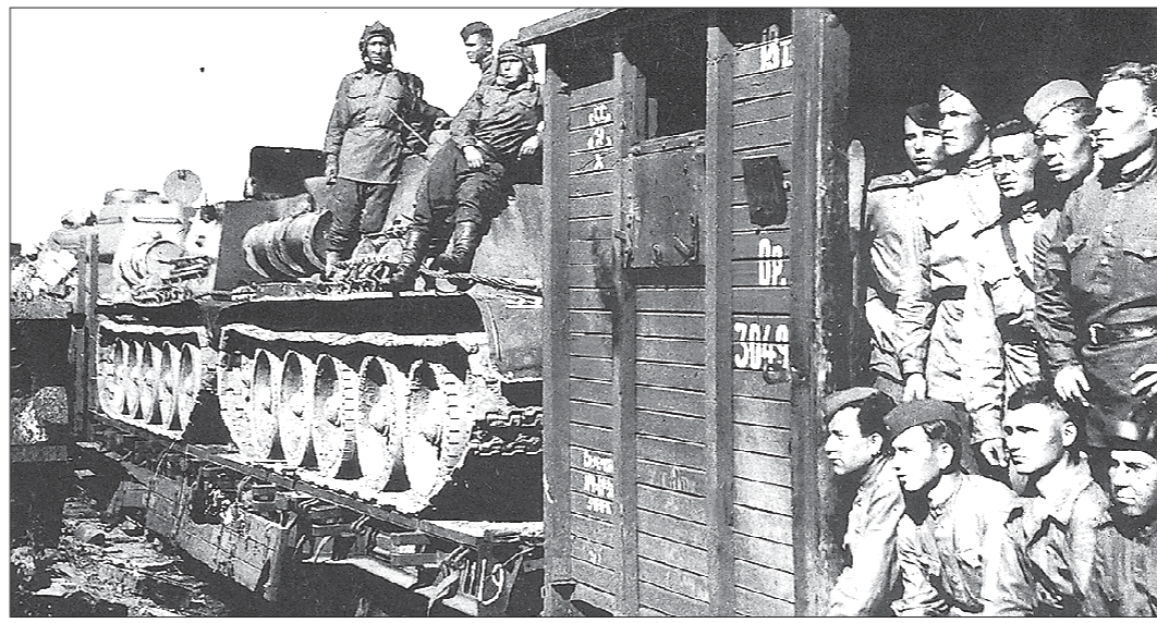
Уральские танкисты отправляются на фронт. Шезлоном был организован «зелёный коридор»

В самом деле, фронтовых фотографий танкистов корпуса довольно много, они использовались и в книгах об этом уникальном воинском соединении, и в других публикациях. В Уральском государственном военно-историческом музее есть целая фотогалерея танкистов УДТК, правда, виртуальная. Но кто