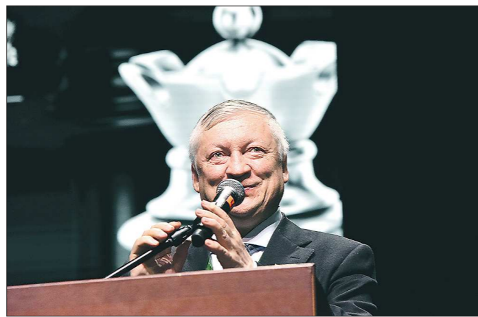
Легендарный гроссмейстер Анатолий Карпов считает, что в Екатеринбурге соберётся весь цвет шахматного мира