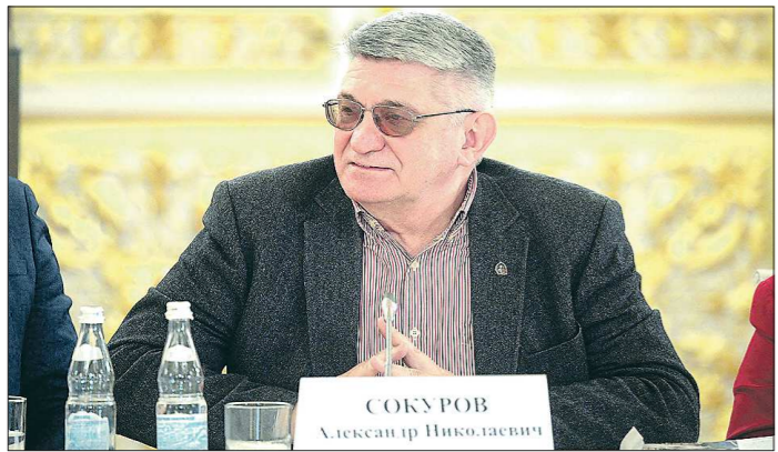
Актуальность, художественная и социальная значимость тем будет рассматриваться Александром Сокуровым с особым вниманием

Подготовлено в соответствии с критериями, утвержденными приказом Департамента информационной политики Свердловской области от 09.01.2018 №1 «Об утверждении критериев отнесения информационных материалов, публикуемых государственными учреждениями Свердловской области, в отношении которых функции и полномочия учредителя осуществляет Департамент информационной политики Свердловской области, к социально значимой информации».