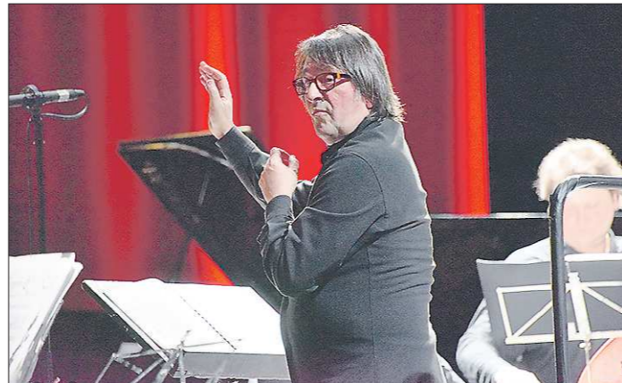
Юрий Башмет сам играл на альте, а позже дирижировал «Солистами Москвы»

– Наш регион по праву считается одним из лидеров отечественного шахматного движения, центром развития шахматной мысли, – отметил губернатор. – Сегодня в шахматы на профессиональном уровне в Свердловской области играют около 20 тысяч человек, в том числе свыше 2,5 тысячи детей и подростков.