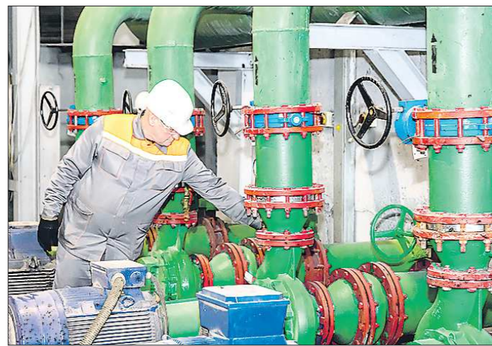
На объекте водоподготовки термоудела Olivotto используется итальянское оборудование

Экологическая работа ведётся сразу по нескольким направлениям: защита почвы от отходов производства и потребления, охрана воздуха и ок-