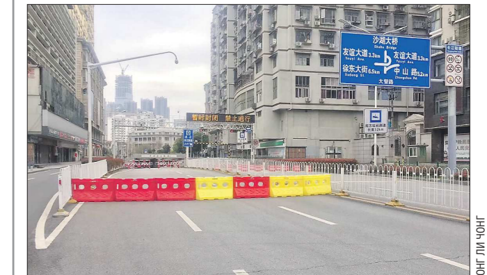
На улицах мегаполиса пока пусто: чтобы выйти из жилого комплекса, придётся объяснить, зачем вам это нужно, на нескольких КПП

Подготовлено в соответствии с критериями, утверждёнными приказом Департамента информационной политики Свердловской области от 09.01.2018 №1 «Об утверждении критериев отнесения информационных материалов, публикуемых государственными учреждениями Свердловской области, в отношении которых функции и полномочия учредителя осуществляет Департамент информационной политики Свердловской области, к социально значимой информации».