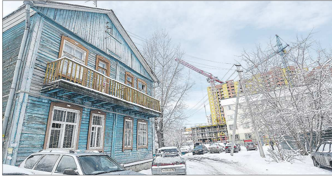
В ста метрах от дома на ул. 40-летия Октября, 39 идёт строительство ЖК «Мир.Труд.Май», который возводит ООО «Милстрит»