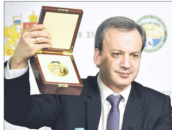
Аркадий Дворкович представил медаль, которую получит победитель турнира

Сами же гроссмейстеры, думается, посвятят вечер финальной подготовке. Вечер, 17 марта, они сыграли свои первые партии. Тур завершится уже после подписания номера «Область».