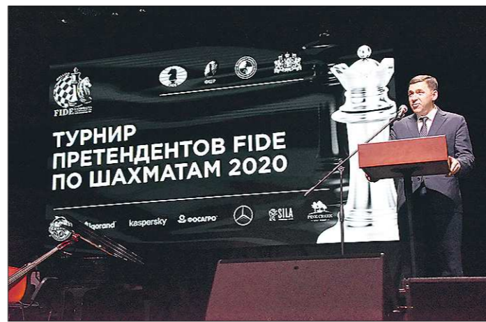
Глава региона Евгений Куйвашев дал старт шахматной битве в столице Урала