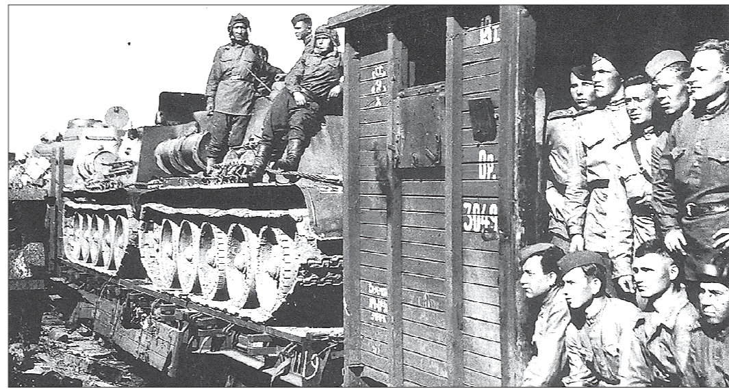
Уральские танкисты отправляются на фронт. Шезлоном был организован «зелёный коридор»

В самом деле, фронтовых фотографий танкистов корпуса довольно много, они использовались и в книгах об этом уникальном воинском соединении, и в других публикациях. В Уральском государственном военно-историческом музее есть целая фотогалерея танкистов УДТК, правда, виртуальная. Но кто