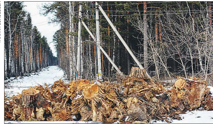
УГМК высажит новые деревья в Екатеринбурге и Верхней Пышме вместо тех, которые были срублены. Место пока определяется