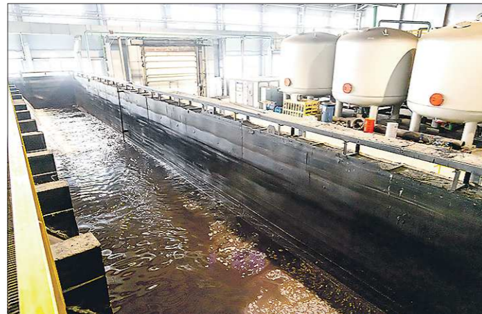
Благодаря цехам очистки СинТЗ может использовать одну и ту же воду несколько раз

рава вод. Последний вопрос – особенно непростой.