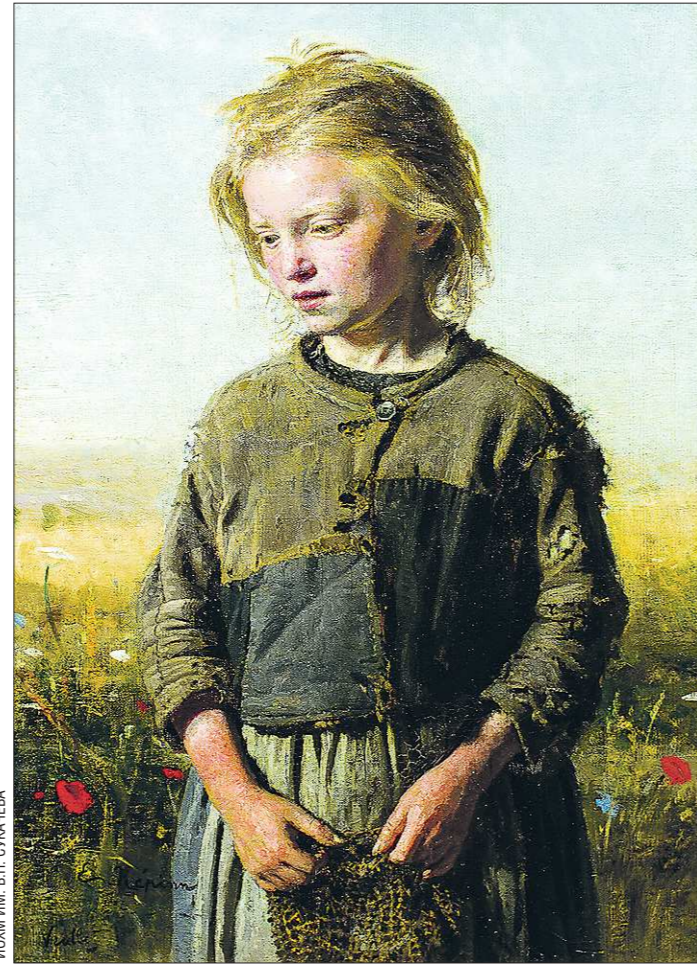
Илья Репин – «Нищая» (1874 год)

К слову, Нижегородский государственный художественный музей тоже представил настоящие жемчужины. Кроме «Мужичка из робких», это, в числе прочего, ещё и работа «Христос», и эскиз одной из самых известных работ Репина – «Иван Грозный и сын его царевич Иван 16 ноября 1581 года», часто называемой «Иван Грозный убивает своего сына». Именно благодаря таким эскизам мы видим, как художник искал необходимые интонации. – У нас коллекция доста-