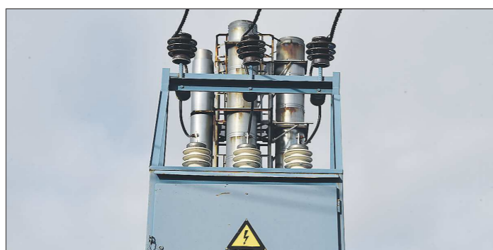
Появление испытательного центра высоковольтного оборудования решает ряд ключевых задач, таких как повышение энергетической безопасности страны, борьба за рынки сбыта и развитие науки