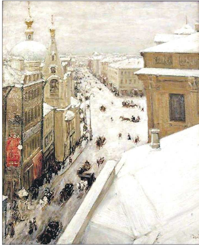
Игорь Грабарь – «Улица Москвы Тверская» (1880-е)

В официальном каталоге собраны трогательные воспоминания из писем самого Репина и его учеников. К примеру, в одном из них художник признаётся, как волновался перед началом учебного процесса, как хотел привить молодым творцам любовь к правде жизни. Быв-