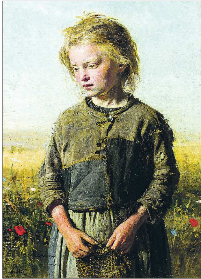
Илья Репин – «Нищая» (1874 год)

К слову, Нижегородский государственный художественный музей тоже представил настоящие жемчужины. Кроме «Мужичка из робких», это, в числе прочего, ещё и работа «Христос», и эскиз одной из самых известных работ Репина – «Иван Грозный и сын его царевич Иван 16 ноября 1581 года», часто называемой «Иван Грозный убивает своего сына». Именно благодаря таким эскизам мы видим, как художник искал необходимые интонации. – У нас коллекция доста-