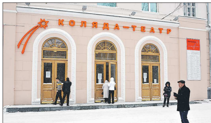
В здании бывшего кинотеатра «Искра» театр Николая Коляды обосновался в апреле 2014 года