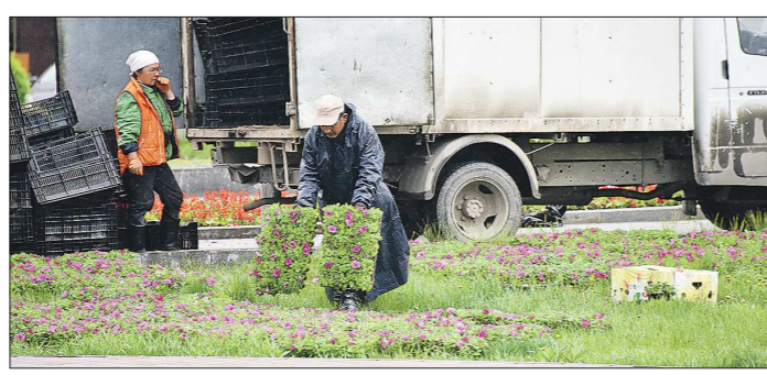
Цветы в клумбы в Екатеринбурге высаживают весной, а саженцы декоративных кустарников - осенью

Подготовлено в соответствии с критериями, утвержденными приказом Департамента информационной политики Свердловской области от 09.01.2018 №1 «Об утверждении критериев отнесения информационных материалов, публикуемых государственными учреждениями Свердловской области, в отношении которых функция и полномочия учредителя осуществляет Департамент информационной политики Свердловской области, к социально значимой информации».