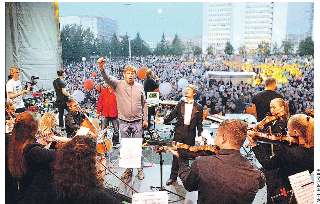
Ради появления на сцене фестиваля «Уральская ночь музыки» спортивный комментатор Дмитрий Губерниев в 2018 году отлучился из Москвы, где вёл прямые эфиры с чемпионата мира по футболу