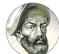
Ермак Тимофеевич - казачий атаман, завоеватель Сибири для Русского государства

История Усть-Утки, входящей сегодня в состав округа Нижний Тагил, уникальна. Деревня была рубежной между владениями двух семей некоронованных властителей