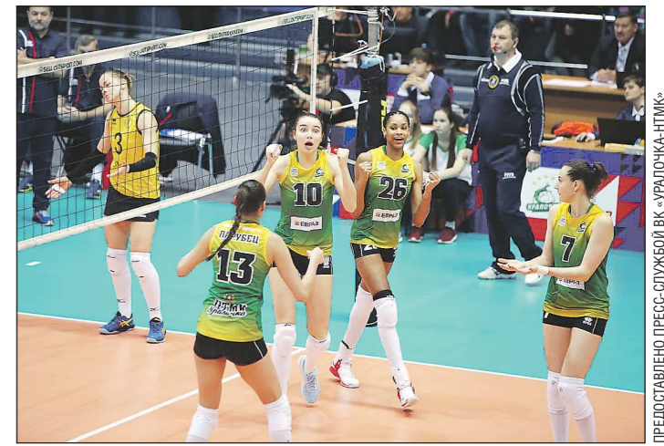
«Уралочка» в регулярном чемпионате сезона 2019/2020 одержала 13 побед

Вопросов, как обычно, больше, чем ответов. Да и будут ли эти ответы даны обычным болельщикам, прильнувшим к экранам телевизоров в надежде, что мы приехали в Италию побеждать... Это ещё больший вопрос. Биатлон окончательно превратился в минное поле. После каждого успеха — ждётся подвоха. Он может случиться через год, а может, и через шесть лет. Но, кажется, так будет ещё долго.