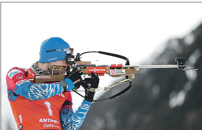
Александр Логинов завоевал свою первую золотую медаль на чемпионатах мира. Остается надеяться, что не последнюю

В итальянской Антерсельве в минувшие выходные состоялся последний этап гонки чемпионата мира по биатлону. Сборная России, силами Александра Логинова, завоевала на турнире две медали — золото и бронзу. Однако радость от долгожданных наград омрачилась скандалом: утром перед эстафетной гонкой к лидеру сборной России пришла с обыском местная полиция.