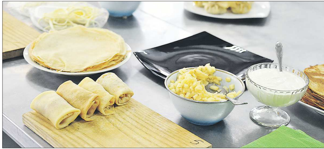
На Среднем Урале блины часто пекли в печи - тогда они получались толще, чем обычные

Считается, что в огне сгорало всё плохое, что было в людских помыслах - так они готовились к Великому посту. Молодые люди катались в санях по улицам. Ещё был выезд на коне Масленицы - мужика, наря-