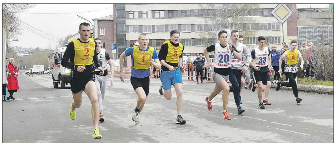
Ежегодную легкоатлетическую эстафету невьянцы по традиции приурочивают ко Дню Победы