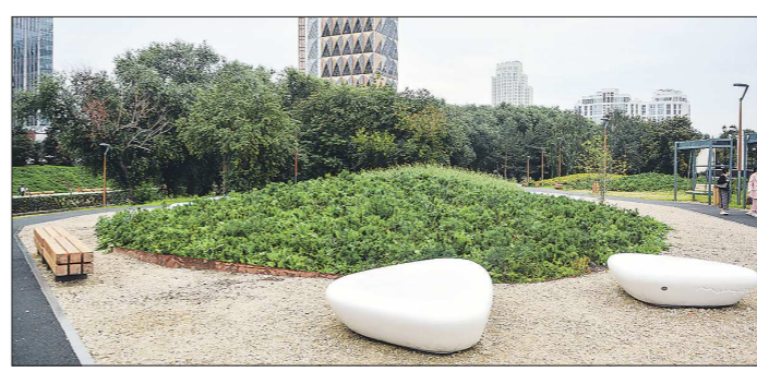
Сейчас в моде облагораживать территорию не только цветущими растениями, но и декоративной зеленью

Конкретные планы по озеленению мэрия ещё не обнародовала, но некоторые шаги в этом направлении известны. Например, есть намерение продолжить реконструкцию улицы Вайнера - здесь увеличатся зоны отдыха, пешеходную улицу украсят малые архитектурные формы. Обновление ждёт и переулки Театральный и Банковский. Этим займётся компания «Архитек», которая осуществляла благоустройство парка «Зелёная роща». Плани-