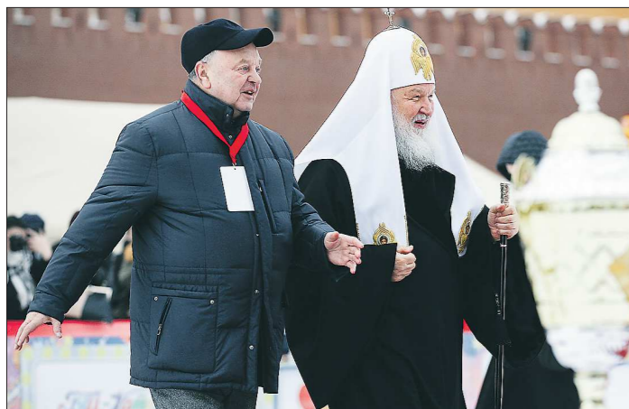
Президент Российской и Международной федераций хоккея с мячом Борис Скрынник и Патриарх Кирилл пришли поприветствовать юных хоккеистов