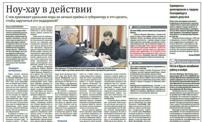
Ню-хуа в действии