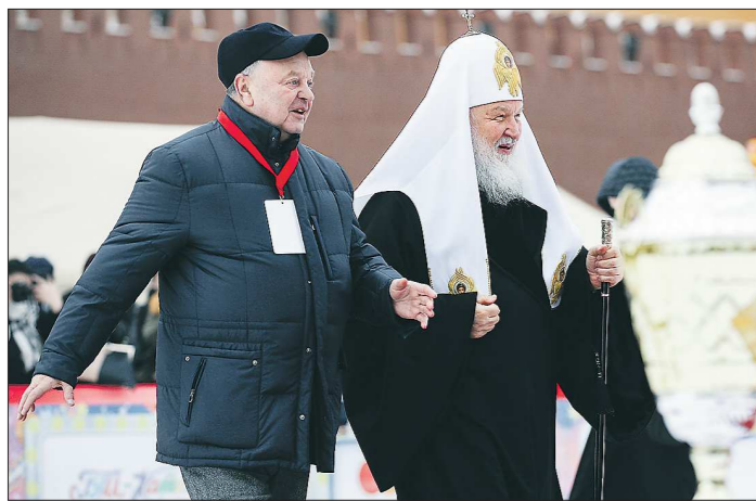
Президент Российской и Международной федераций хоккея с мячом Борис Скрынник и Патриарх Кирилл пришли поприветствовать юных хоккеистов