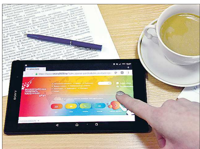
Принять участие в переписи-2020 можно будет прямо с планшета