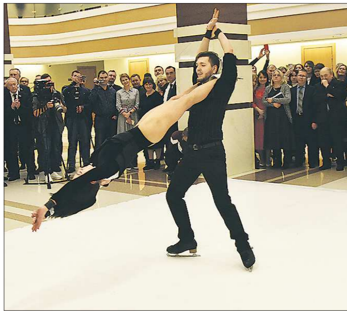
Технология «синтетического льда» позволяет показывать ледовое шоу практически в любом месте

Здесь же использовался именно не искусственный, а «синтетический лёд», принципиально иная технология. Строго говоря, это и не лёд вовсе, не застывшая под воздействием низких температур во-