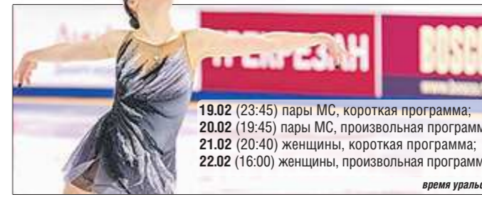
19.02 (23:45) пары МС, короткая программа; 20.02 (19:45) пары МС, произвольная программа; 21.02 (20:40) женщины, короткая программа; 22.02 (16:00) женщины, произвольная программа.

Анастасия Мишина и Александр Галлямов в дебютном на взрослом уровне сезоне уже стали обладателями бронзы серии Гран-при, буквально вчерашний в элите мирового фигурного катания. Но чтобы отобраться на чемпионаты Европы и мира, им не хватило совсем