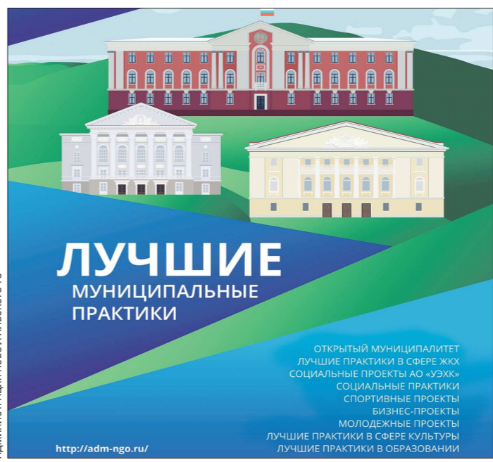
Администрация Новоуральского района

В списках победителей всероссийского конкурса прошлых лет – населённые пункты с самыми разными проектами. Город Урюпинск, где благодаря работе ТОСов жители стали в два раза реже обращаться в мэрию. Старополе, где достигнут беспрецедентно высокий уровень повседневной гражданской активности – в городском самоуправлении участвует почти 93% населения. Небольшое село Ворсино в Калужской области, где разместили индустриальный парк на 40 резидентов.