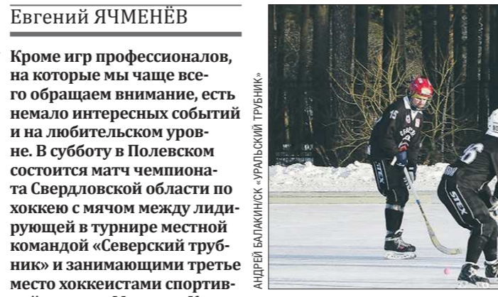
Чемпионат Свердловской области – один из старейших турниров в России. Первый турнир состоялся в 1927 году

Правда, тут надо отметить, что любителей в бытовом понимании в командах по хоккею с мячом практически нет. И связано это в первую очередь с тем, что одним из главных компонентов игры является более или менее приличное владение коньками. Поэтому большинство игроков – это либо бывшие профессиональные хоккеисты, которые не спешат повесить коньки на гвоздь и занимаются лю-