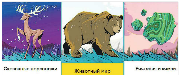
Все претенденты были разделены на три категории на первом этапе голосования

Выставка открыта до 25 февраля. Вход свободный.