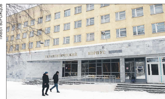
Так выглядит нынешний терапевтический корпус 354-го Военного клинического госпиталя Минобороны России