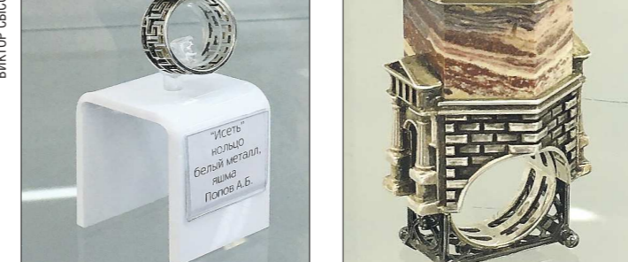
А это... гостиница «Исеть» из белого металла и яшмы