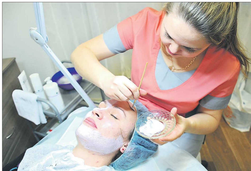
Среди самозанятых на Среднем Урале сегодня много представителей индустрии красоты

«Долго ждала начала эксперимента у нас в области, на учёт встала уже 2-го января. Сейчас я могу открыто давать рекламу и не бояться, что чем-то недовольная клиентка может на меня пожаловаться в налоговую...»