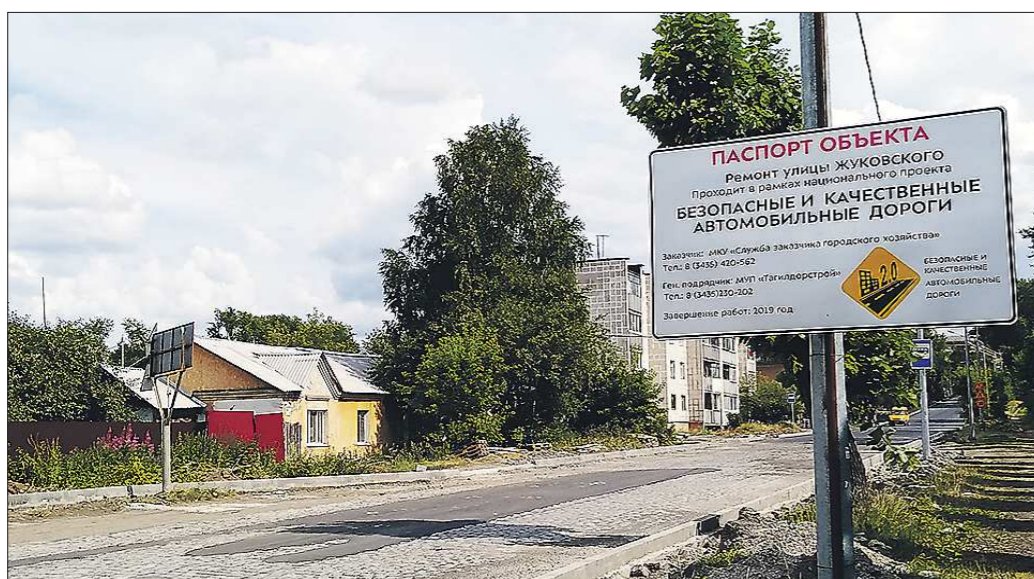
В 2020 году планируется отремонтировать около 140 км дорог

«По словам депутата Госдумы, свердловчан заинтересовала новая для российской избирательной системы технология предотвращения «каруселей»: маркировка избирателей специальными спреями».