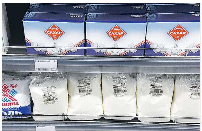
Сейчас полки заставлены дешёвым сахаром, но покупателю зимой этот продукт малоинтересен

Подготовлено в соответствии с критериями, утвержденными приказом Департамента информационной политики Свердловской области от 09.01.2018 №1 «Об утверждении критериев отнесения информационных материалов, публикуемых государственными учреждениями Свердловской области, в отношении которых функции и полномочия уполномоченного осуществляет Департамент информационной политики Свердловской области, к социально значимой информации».