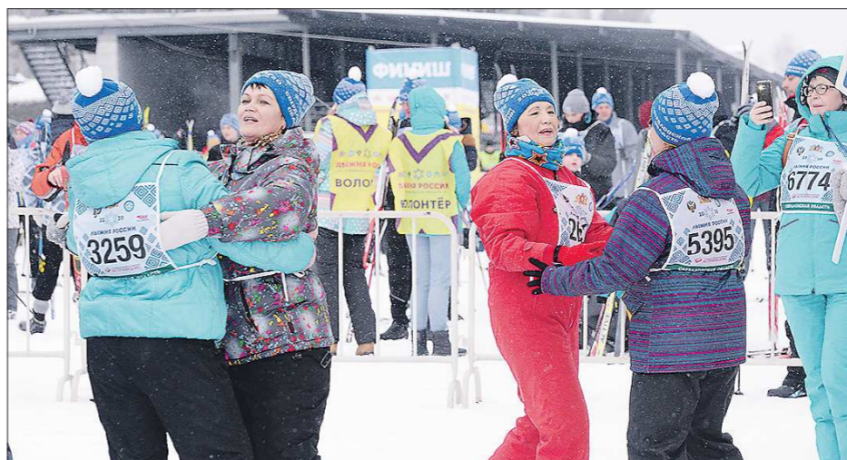
«Лыжня России» на «Старателе» – это всегда больше, чем просто лыжные гонки. Это ещё и большой праздник

году было 15 тысяч). А в целом по Свердловской области участниками спортивного праздника «Лыжня России – 2020» стали около 90 тысяч наших земляков самого разного возраста и уровня подготовки. Всего же к этой акции присоединились 73 региона России,