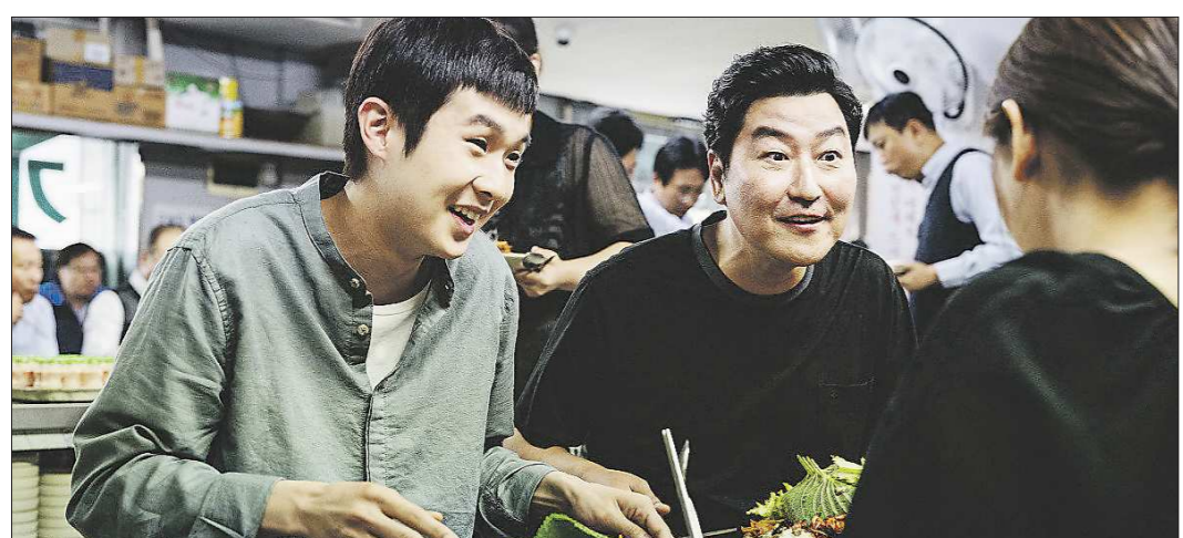
«Паразиты» – главная сенсация 92-го «Оскара». Полный список победителей можно посмотреть на сайте – oblgazeta.ru

Подготовлено в соответствии с критериями, утвержденными приказом Департамента информационной политики Свердловской области от 09.01.2018 №1 «Об утверждении критериев отнесения информационных материалов, публикуемых государственными учреждениями Свердловской области, в отношении которых функции и полномочия учредителя осуществляет Департамент информационной политики Свердловской области, к социально значимой информации».