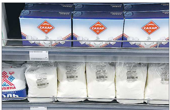
Сейчас полки заставлены дешёвым сахаром, но покупателю зимой этот продукт малоинтересен

Подготовлено в соответствии с критериями, утвержденными приказом Департамента информационной политики Свердловской области от 09.01.2018 №1 «Об утверждении критериев отнесения информационных материалов, публикуемых государственными учреждениями Свердловской области, в отношении которых функции и полномочия уполномоченного осуществляет Департамент информационной политики Свердловской области, к социально значимой информации».