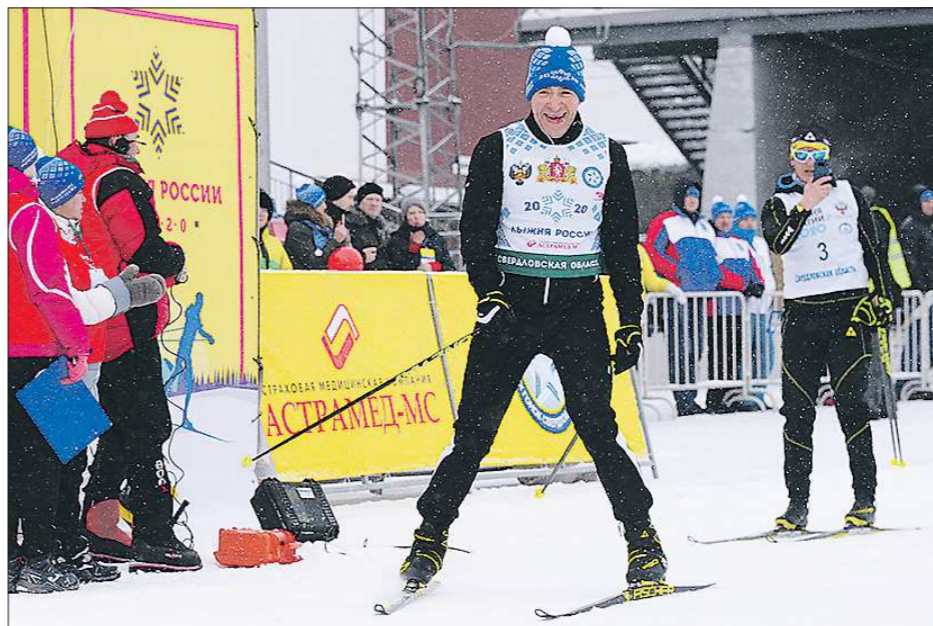
Евгений Куйвашев сначала дал старт выстрелом из пушки мастерской гонке, а затем преодолел 2020 метров в забеге для почётных гостей

В центральной уральской гонке на полигоне «Старатель» приняли участие 17,5 тысячи человек (для сравнения – в прошлом