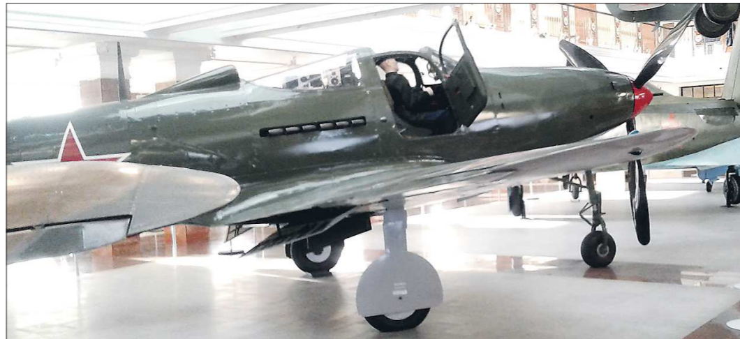
Самолёт «Аэрокобра» в Музее военной техники УГМК

Но главные сражения и крупные победы были впереди. В декабре 1942 года 16-й ГИАП отпраздновал в тылу на перевороте. Лётчики стали осваивать поступающий в Советский Союз по ленд-лизу американский истребитель P-39 «Аэрокобра». Самолёт имел необычную компоновку – двигатель распо-