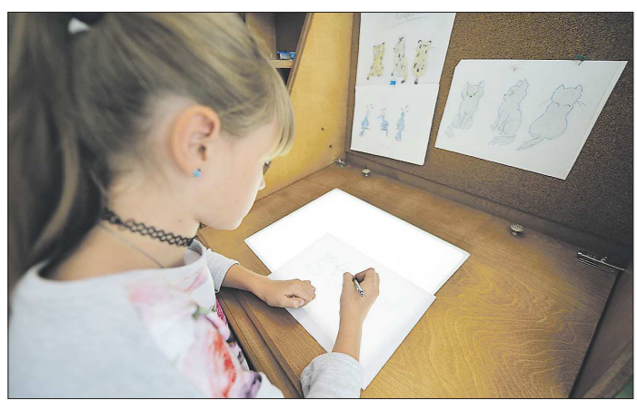
Кроме показов на фестивале также запланированы мастер-классы