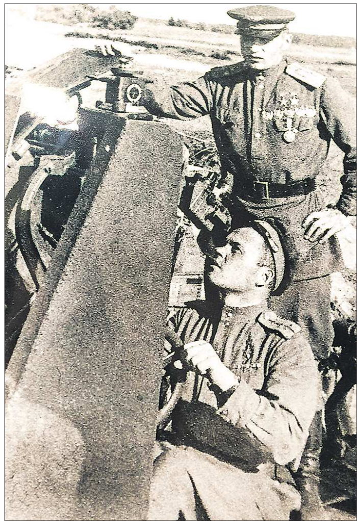
Григорий Речкалов (внизу) и Александр Покрышкин у зенитного орудия. 1943 год

В этих боях Григорий Речкалов одержал 19 побед. 24 мая 1943 года ему присвоили звание Героя Советского Союза. Легендарным становится и сам 16-й гвардейский полк под командованием Александра Покрышкина. В 1944 году Покрышкин впервые в стране был удостоен третьей звезды Героя Советского Союза, а Речкалов летом того же года по-