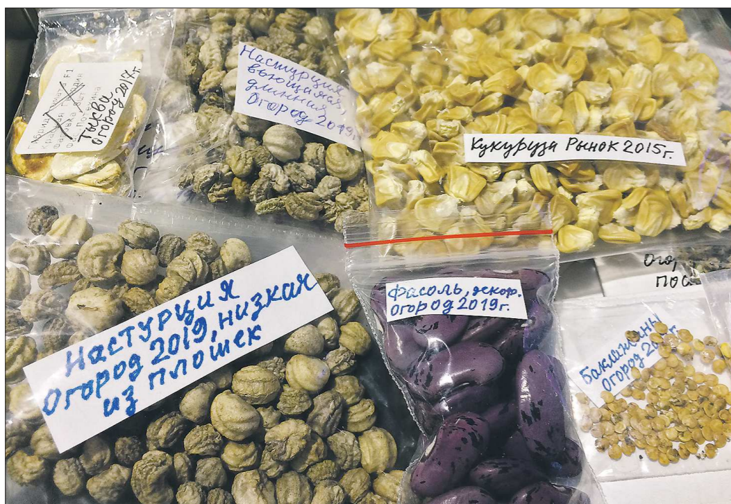
Вместе с семенами овощей в посылках из Китая могут содержаться семена опасных сорняков и насекомые-вредители. А вот коронавирус с ними не придёт