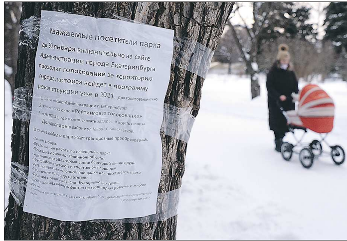
Такие объявления расклеили в парке в начале этого года. Его посетителям пообещали, что «в случае победы парк ждут грандиозные преобразования»