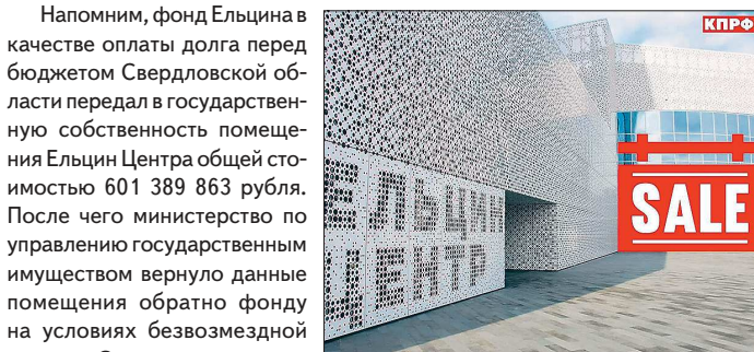
В КАТЕРИНБУРГЕ ПРЕДЛОЖИЛИ СПАСИ МЕСТНЫЙ БЮДЖЕТ, ПРОДАВ ЕЛЬЦИН ЦЕНТР