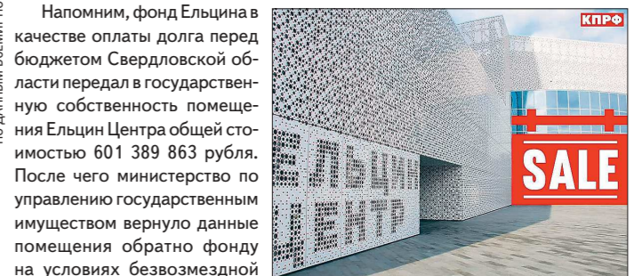
В КАТЕРИНБУРГЕ ПРЕДЛОЖИЛИ СПАСИ МЕСТНЫЙ БЮДЖЕТ, ПРОДАВ ЕЛЬЦИН ЦЕНТР

Свердловское областное отделение КПРФ предлагает продать государственную долю Ельцин Центра.