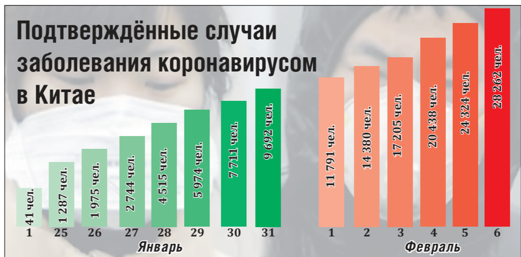
Кроме того, 208 человек на 6.02 заражены коронавирусом в 22 странах, в том числе 2 — в России

Вчера количество выздоровевших от коронавируса больше чем вдвое превысило количество умерших: 1 290 человек против 564.