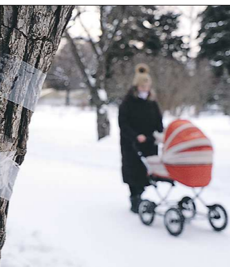
Такие объявления расклеили в парке в начале этого года. Его посетителям пообещали, что «в случае победы парк ждут грандиозные преобразования»

Вчера на заседании правительства Свердловской области обсудили, как и где в ближайшие годы в регионе появятся новые школы.