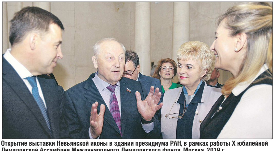
Открытие выставки Невьянской иконы в здании президиума РАН, в рамках работы X юбилейной Демидовской Ассамблеи Международного демидовского фонда. Москва, 2019 г.