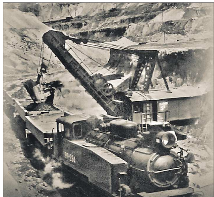
Никогда Высокогорский железный рудник (сейчас Высокогорский ГОК) не трудился так удачно, как в военные годы. Производство товарной железной руды превысило предвоенный уровень в 2,3 раза

— Это сейчас на ВЖРКе взрывают редко, а когда мы работали, взрывы проходили через день-два. Перед закладкой взрывчатки надо было убрать звенья путей, чтобы не