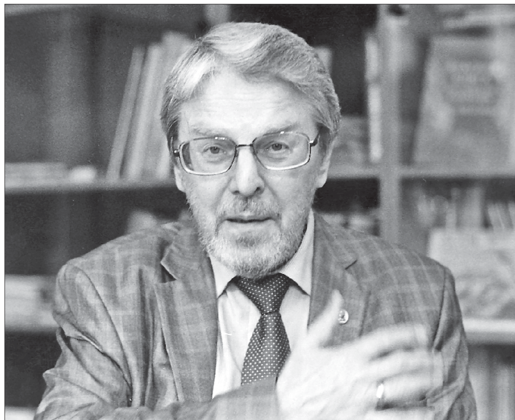
Академик Вячеслав Рожнов разработал стратегию по спасению редких видов животных в России

Во всех наших делах всемерно поддержку нам оказывало Министерство по чрезвычайным ситуациям РФ. В 2008 году к нам в экспедицию приезжали Владимир