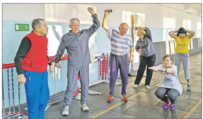
В группе спортшколы легкой атлетики занимаются 14 пенсионеров

Подготовлено в соответствии с критериями, утвержденными приказом Департамента информационной политики Свердловской области от 09.01.2018 №1 «Об утверждении критериев отнесения информационных материалов, публикуемых государственными учреждениями Свердловской области, в отношении которых функции и полномочия уполномоченного органа осуществляет Департамент информационной политики Свердловской области, к социально значимой информации».