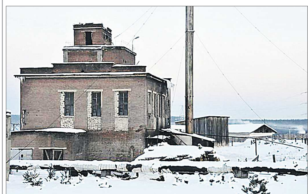
Котельные многих предприятий снабжают горячей водой и теплом не только производство, но и жилые дома