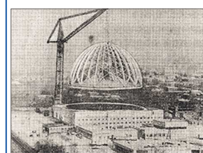
Накануне 1 апреля «ОГ» опубликовала этот снимок, пояснив, что следом за крышей екатеринбургского цирка разберут и его стены, так как стоящая неподалеку телевизионная башня начала падать. К удивлению редакции, многие читатели приняли первоапрельский розыгрыш за чистую монету.