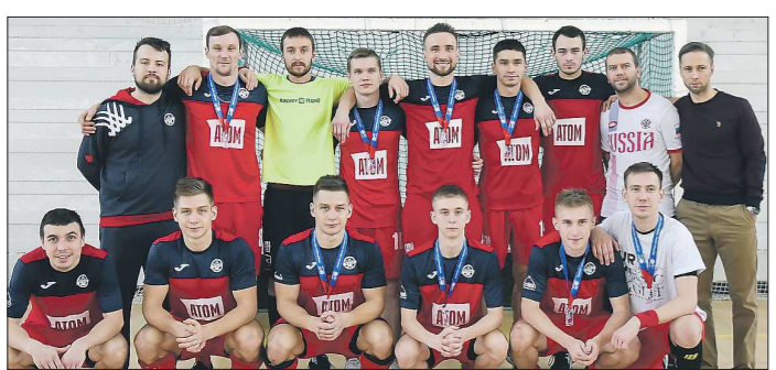
«Динамо-Стройтель» с серебряными медалями чемпионата России

— Вы изучаете не только наземных хищников, но и морских млекопитающих.