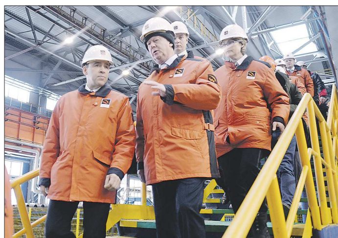
Анатолий Чубайс (справа) и Евгений Куйвашев в ходе осмотра нового комплекса активно обсуждали дальнейшее сотрудничество РОСНАНО и Свердловской области

Уроженец Лесного, наставник молодёжной сборной России по хоккею назначен старшим тренером основной национальной команды.