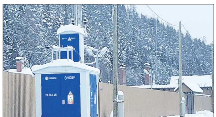
Благодаря упорству жителей Нижняя Ослянка чудом выжила в процессе ликвидации «бесперспективных» населённых пунктов, а теперь ещё и вернула электроснабжение

сняли, и деревня осталась в потёмках. В 46 домах, расположенных на двух берегах реки, проживает шесть граждан с местной регистрацией, остальные – дачники.