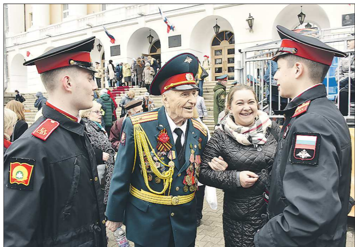
Ветераны рады тому, что им подрастает достойная смена