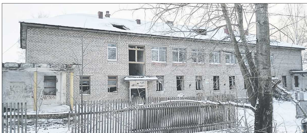
Здание бывшей поликлиники в Кушве находится рядом с котельной и водоводом – к нему не нужно прокладывать сети

Подготовлено в соответствии с критериями, утверждёнными приказом Департамента информационной политики Свердловской области от 09.01.2018 №1