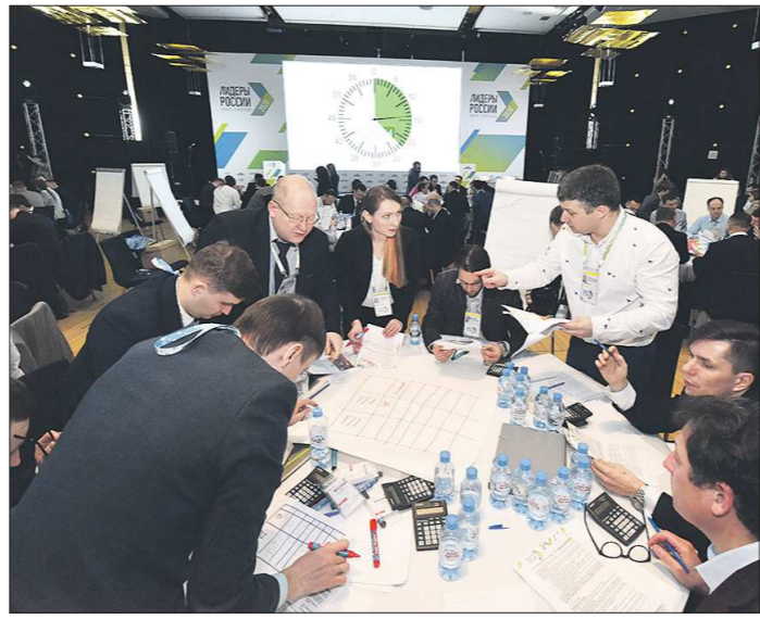
На решение сложнейших вопросов участникам конкурса отводилось очень мало времени

В столице Урала прошёл региональный этап конкурса управленцев нового поколения «Лидеры России». Согласно информации, размещённой на официальном сайте конкурса, целями этого проекта являются «выявление, развитие и поддержка перспективных руководителей, обладающих высоким уровнем лидерских качеств и управленческих компетенций».