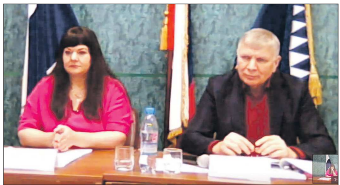
Онлайн-трансляция дебатов велась в прямом эфире