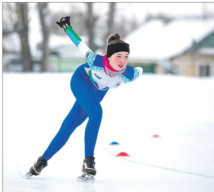
Соревнования прошли в возрастных категориях от девяти до четырёхнацати лет